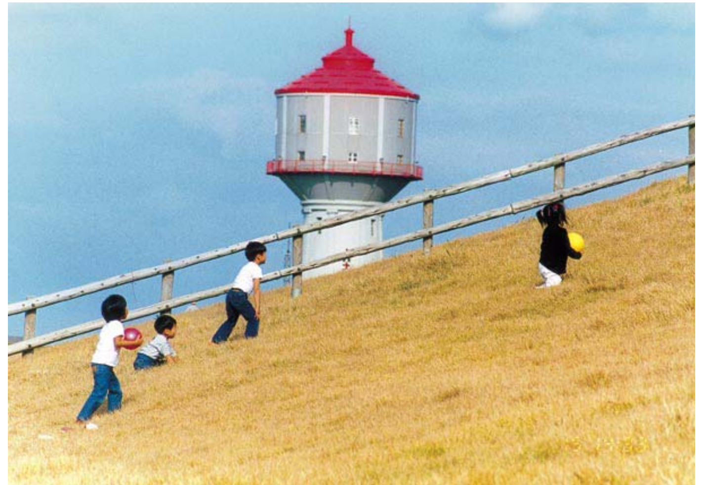
最優秀賞「お気に入りの遊び場」

【講評】 長岡の象徴として残されている唯一の文化財水道塔。歴史と時間の流れを静かに語りかける。その前を次代を担う子どもたちが未来に夢を託して走る。過去から現代へ、そして未来への時の流れが観る人の心をつ。