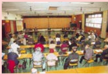
厚生会館中ホールで（1月17日）

【市長】コンピュータ関係の分野に進出している長岡の企業は景気が良くなってきています。そのため法人税も増収の傾向にあります。今、もともと長岡にある企業が先端企業へ転換して力を付け、長岡技術科学大学、長岡工業高等専門学校、長岡造形大学などを卒業した技術者もたくさん育っています。