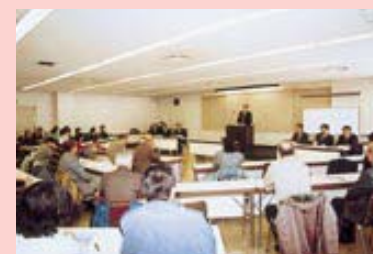
市立劇場大会議室で（1月20日）

不法投棄の問題や廃棄物の処理方法など、ごみを減らすにはどうしたらよいか、現在、検討中です。ごみの問題については市民のみなさんと相談しながら取り組んでいきたいと思っています。