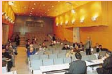
中央図書館講堂で（1月18日）

【環境部長】これまでの大量生産、大量消費、大量廃棄という生活様式そのものを変えなければいけません。ごみを減らすためにはリサイクルなどいろいろな方法がありますが、有力な方法の一つとしてごみの有料化が考えられます。また、ごみを多く出す人と少なく出す人の負担の公平を図る必要もあります。