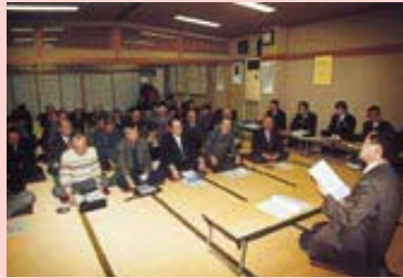
宮内公民館で（1月16日）

【質問・意見】いきいき市民応援プロジェクトのプロジェクト4の「長岡を知ろう」キャンペーンについて - 自分の住んでいる地域を知ることが大事だと思う。ぜひ、進めてほしい。 【市長】わかりやすいパンフレットを作ることから始めたいと考えています。説明のできるボランティアのみなさんもたくさんいると思います。町内会で見て回りたいという要望が