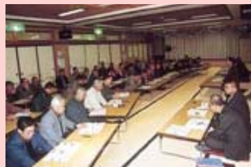
高齢者センターまきやま（1月22日）

【市長】どこに話を聴きに出かけても、「子どもが室内で遊べる場所をつくってほしい」という声を聴きます。市長への手紙でもたくさんきます。外の安全な遊び場が少なくなっていることや核家族になっ