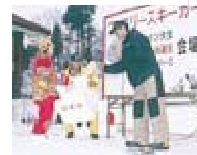
お楽しみ抽選会もあるよ!

無料レッスン&デモンストレーション 長岡スキー学校のスタッフによるレッスンとデモンストレーションです。 レッスン = 午前10時~正午、午後1時30分~3時30分 申し込み = 当日会場 イベントタイム 午後1時から 各種ゲーム お楽しみ抽選会 ナイターリフト無料開放 午後5時から タイマツ滑降&雪上花火大会 午後6時から 長岡スキー協会と一般参加者、総勢100人によるタイマツ滑降(中級以上のスキーヤーの飛び入りも大歓迎)。リフトのいすに電飾を取り付け、ゲレンデにはパルンライトが出現。また、大スターマインなどの雪上花火で幻想的な冬の夜空とゲレンデを楽しむことができます。 あたたかい飲み物無料サービス 午後6時から スーパードッグス・アトラクション 午後1時から 雪上フライボールや犬ぞり体験など 24日のリフト運転時間 第1ペアリフト...9:00~16:50 第2ペアリフト...9:00~18:00 19:30~21:00 第3・5リフト...9:00~17:00 市営スキー場行きバス(長岡駅東口6番線発着) 〔長岡駅発~市営スキー場着〕 8:20~8:38 8:50~9:08 10:10~10:28 〔市営スキー場発~長岡駅着〕 11:50~12:08 15:53~16:11 17:15~17:33 積雪や天候の状況により変更や中止の場合があります。