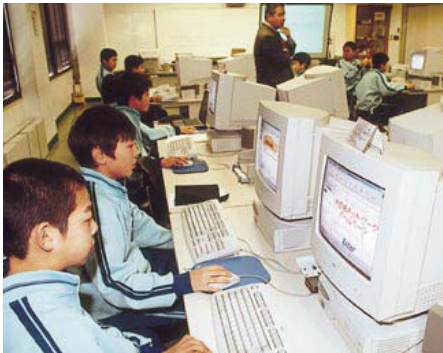
インターネットで資料を検索する国語の「調べ学習」の時間 (南中学校のパソコン教室で) 市立中学校のパソコン教室は「インターネット講習会」会場になります。 お近くの会場を選んで受講できます