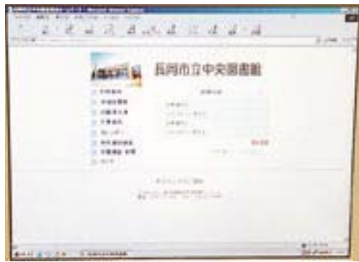
中央図書館のページ http://www.nscs.co.jp/library 長岡市ホームページ http://www.city.nagaoka.niigata.jp からジャンプできます。ぜひご覧ください