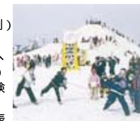
昨年の雪しかな祭り

越後長岡ゆきがっせん大会 18日(日) 1位には5万円分の商品券を進呈。2~4位には賞品、そのほか参加賞あり。 応募 = 1チーム9人以内(7人制) 時間 = 午前9時から 部門 = かえる部門(小学生)へび部門(中学生~大人) 参加料 = 1チーム1500円(保険料等) 申し込み = チーム名、人数、代表者氏名、連絡先、参加部門を記入し、2月10日(土)までに〒940-0065 坂之上町2の1の1長岡商工会議所へ郵送またはFAX 34・4500 組み合わせ抽選会を、2月15日(木)午後7時から中央公民館で行います。