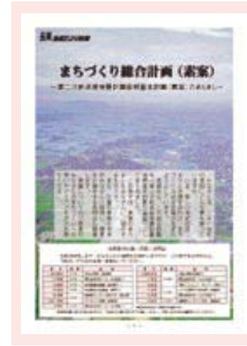
◀長岡市政だより別冊「まちづくり総合計画（素案）」