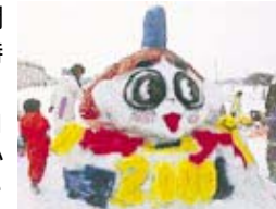
かわいい雪だるまを作ろう!

ながおか100だるま大会 17日(土)・18日(日) 大賞作品には10万円相当の旅行券を進呈(ファミリー・子ども会部門は2作品に5万円相当の旅行券) 日時 = 一般・企業部門...17日(土)午前10時~午後2時 ファミリー・子ども会部門...18日(日)午前10時~午後2時 申し込み = 1チーム3人以上で、2月8日(木)までに長岡観光・コンベンション協会内ながおか100だるま大会実行委員会 ☎ 32・1187、FAX 31・1777へ