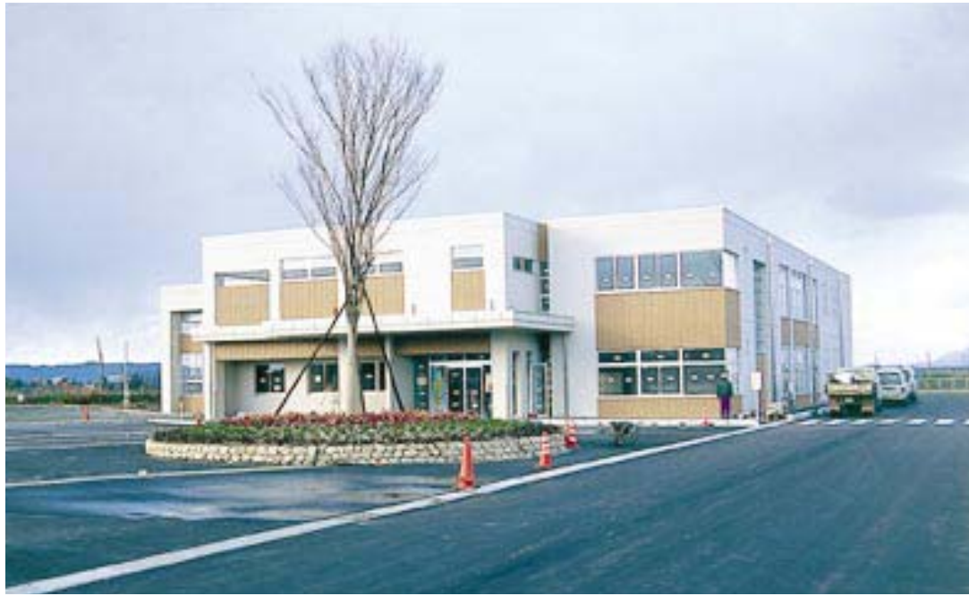
4月にオープンする「エコトピア寿」(寿3)