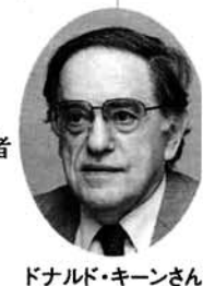
ドナルド・キーンさん