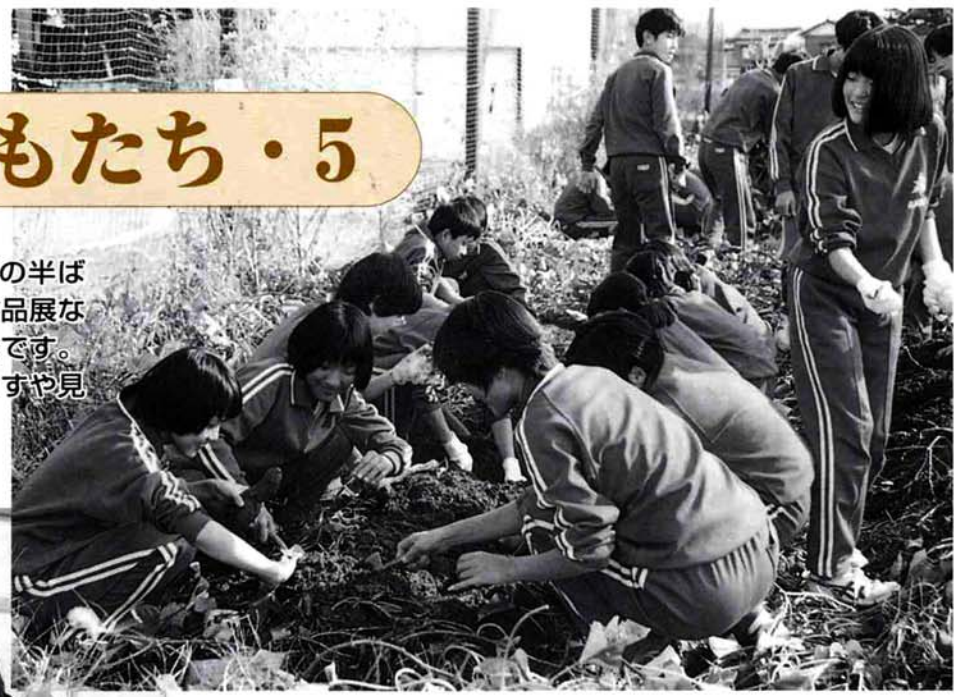
▲堤岡中学校（生徒数344人） 道徳の時間を利用して育ててきたさつまいもの収穫の日。みんなで掘ったさつまいものは、たき火をして焼きいもにしたり、調理室でスイートポテトや大学いもにして楽しむそうです

市内の各小中学校では、2学期の半ばを迎え、遠足などの野外活動や作品展などの活動に取り組んでいるところ。今月号では、子どもたちのようすや見守る先生方の意見を紹介します。