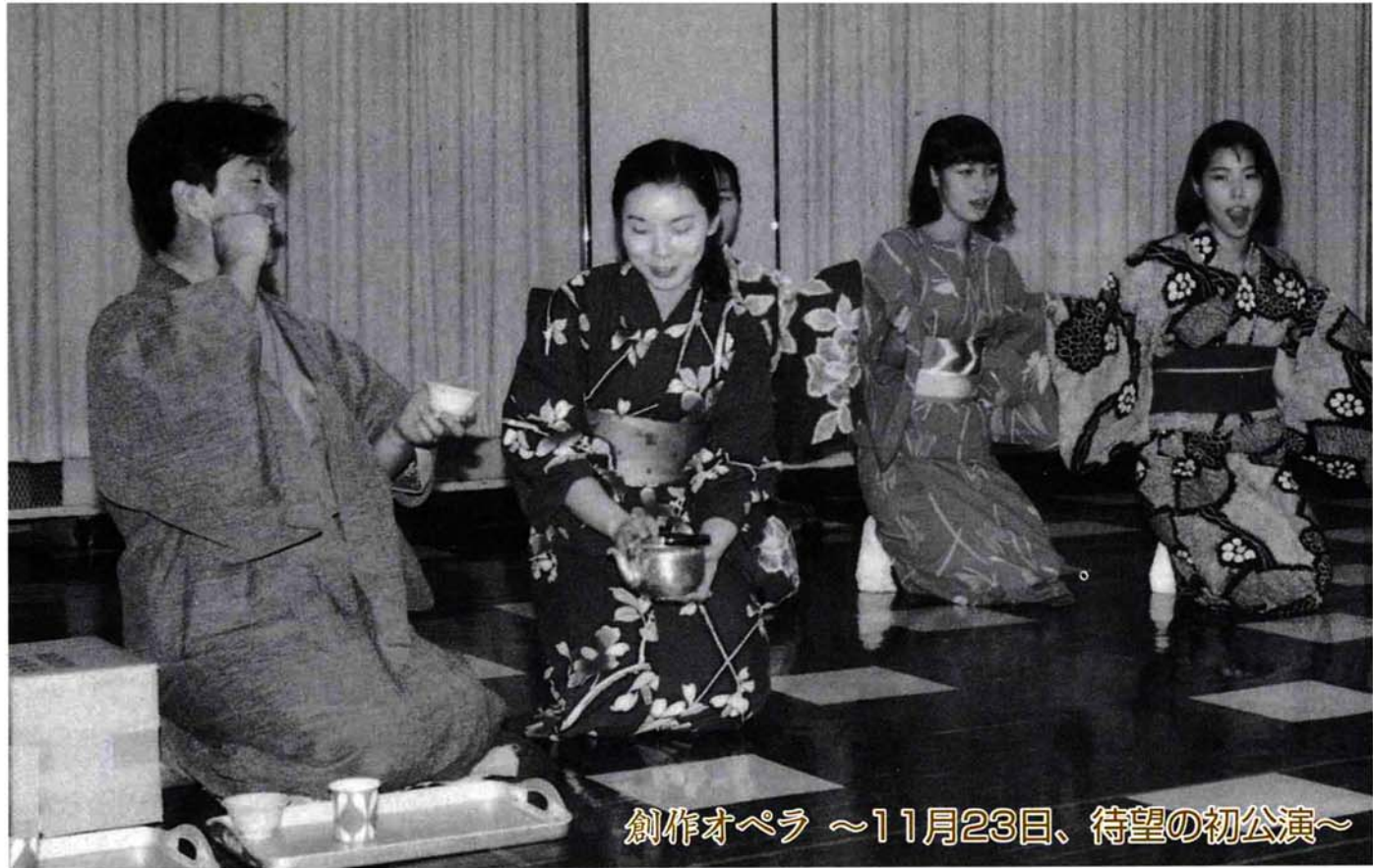
創作オペラ ～11月23日、待望の初公演～