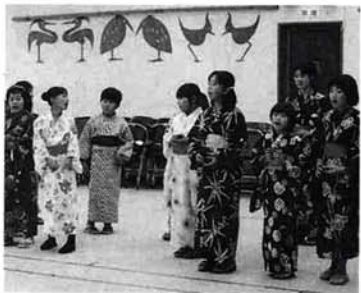
▼12月の座敷の場面（師走の大師講） 児童合唱は41人の小学生。