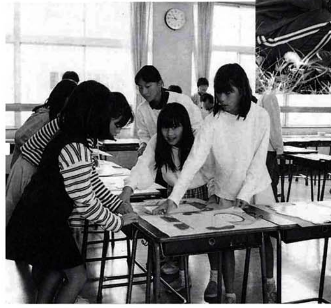
▲宮内小学校（生徒数693人） 全校で取り組んだ作品展の飾りつけの日。5年生の教室では、絵をのせる机の並べ方をみんなで相談。「5年1組だから、数字の5-1のように並べよう」などの意見が活発に出ていました