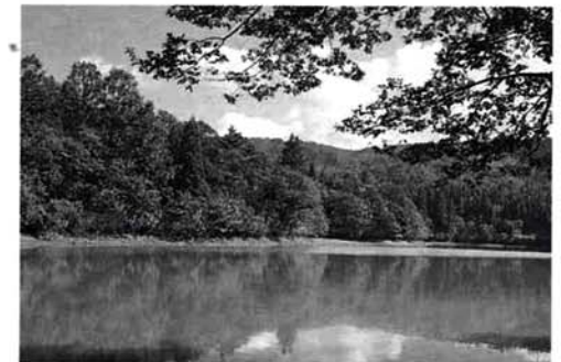
百間堤 (成願寺町、東片貝町)

現在、養鯉池としても利用されている百間堤。10月上旬に鯉が上げられ、水が少なくなると底にある鯉を求めハクセキレイやセグロセキレイなどが見られます。 また、堤の周辺はコナラを主体に、アカマツ、スギなどが混じる山林で、これからの季節は紅葉が美しく、シジュウカラ、エナガ、ヤマガラなどの小鳥類もよく見られるバードウォッチングの適地です。