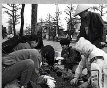
▲5月12日、花の苗を移植する関原地区花いっぱい運動協議会のみなさん