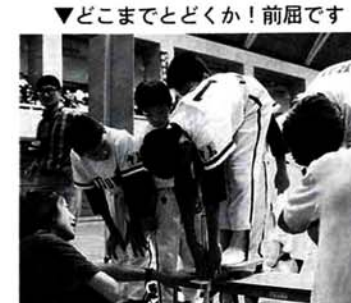
▼どこまでとどくか！前屈です