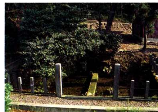
瓜割清水(五反田町)

今も昔も、水は暮らしに欠かせないもの。こうして清水の伝説は、水を大切にすることの大切さを伝えるものでしょう。このほか、東山や西山の村々に、清水の伝説が多く伝えられています。