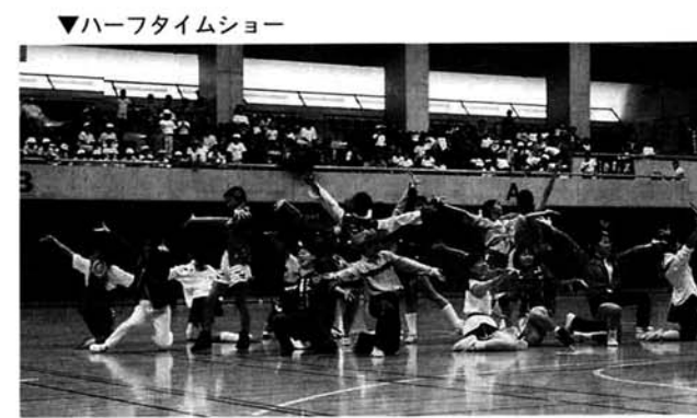
▼ハーフタイムショー