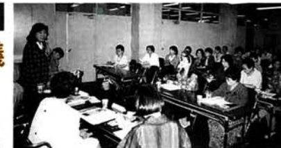
▲会場には、熱心にメモをとる人の姿も

報告は、各自さまざまなテーマを持つてのぞんだメンバーの、積極的な活動ぶりが伝わるものでした。