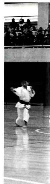
ハーフタイムショーで演武を行う少林寺長岡城西スポーツ少年団のみなさん▶