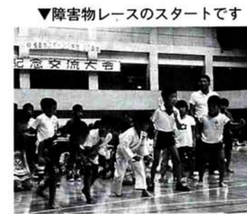
▼障害物レースのスタートです