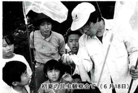
初夏の昆虫観察会(6月18日)

日時 11月11日(土)午後1時30分 から 対象 小・中学生 定員 20人 申し込み 11月5日(日)まで