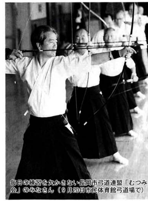
毎日の練習を欠かさない長岡市弓道連盟「むつみ会」のみなさん(9月20日市民体育館弓道場で)