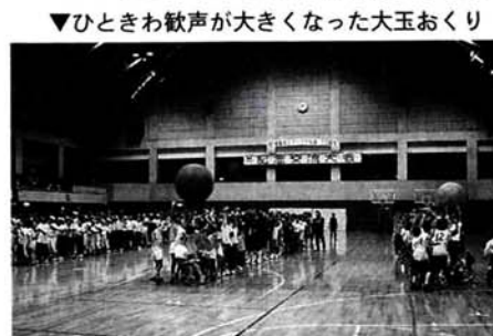
▼ひととき歓声が大きくなった大玉おくり