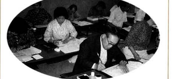
▲あて名書きの仕事に精を出す会員のみなさん

850人の高齢者のみなさんが、豊富な知識と経験を生かして働く シルバー人材センター (今朝白2の8の18) ☎35・2380