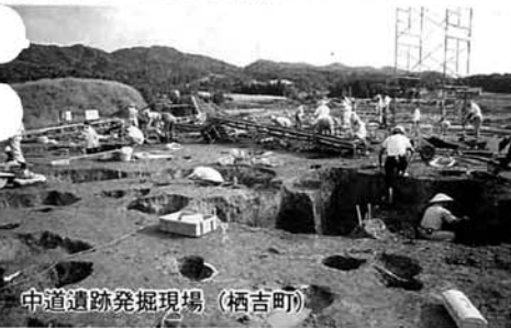
中道遺跡発掘現場(栢吉町)

募集人数 中道遺跡…45人程度 長岡城跡…10人程度 雇用期間 中道遺跡…5月中旬～11月中旬の約80日 長岡城跡…7月下旬～8月上旬の約10日 資格 身体健康な人 職務内容 遺跡の発掘調査 賃金 日当6,700円 勤務時間 午前8時30分～午後5時 問い合わせ 生涯学習課 ☎39・2240