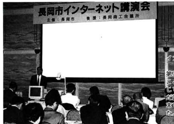
インターネット講演会（先月18日、市内ホテルで）

第三の通信手段として、地域産業の振興にも大いに寄与することが期待されるインターネット。このインターネットを通じて阪神・淡路大震災の情報が内外に発信されたことは、また記憶に新しいところです。講演会では、会場に設置した端末でインターネットと交信し、実際の活用方法も示されました。