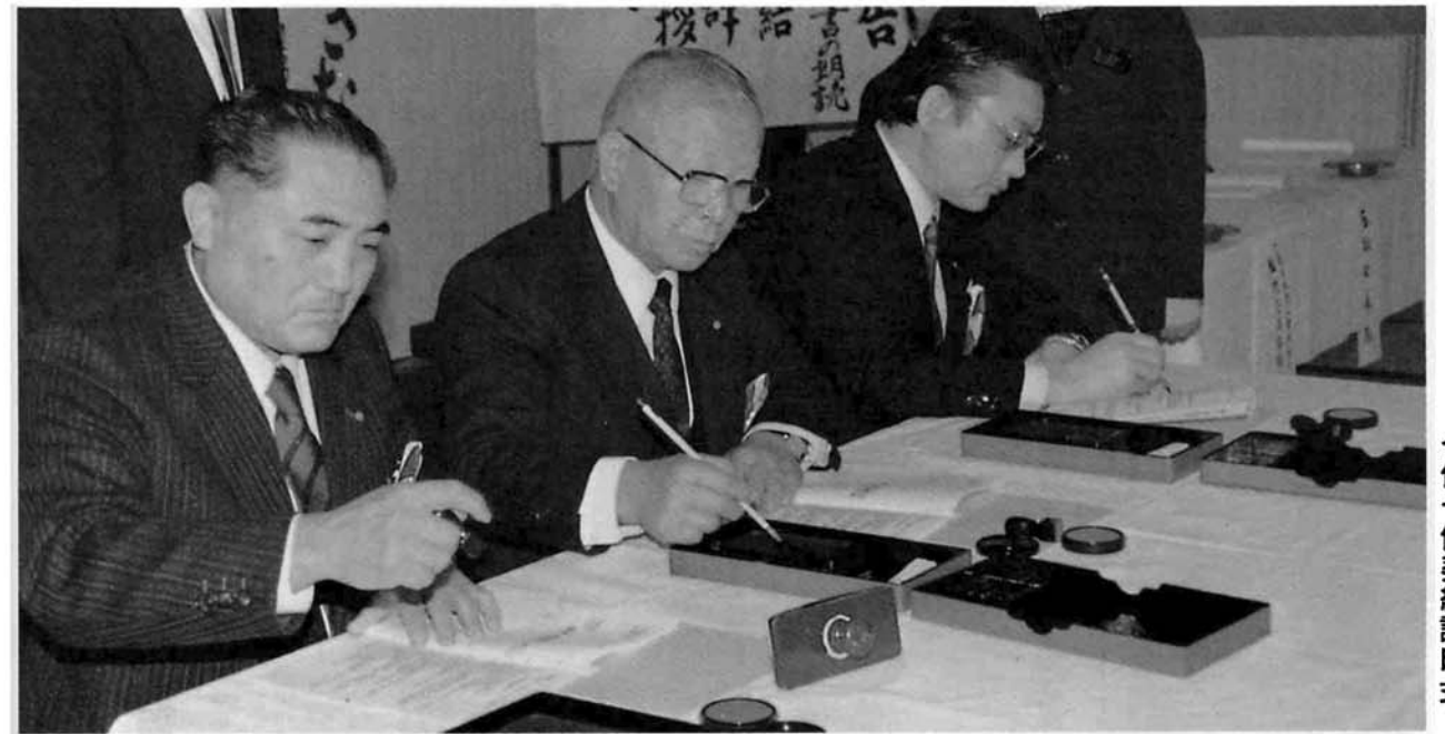
合併予備契約調印式