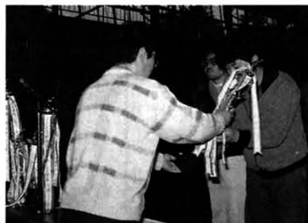
久々に返り咲き？ Aブロック優勝 脇野町Aチーム

寒さもひとしお身にしみる当日、参加二十三チームにより、技ありパワーあり子供たちの大きな声援の送られる中熱戦が繰り広げられました。