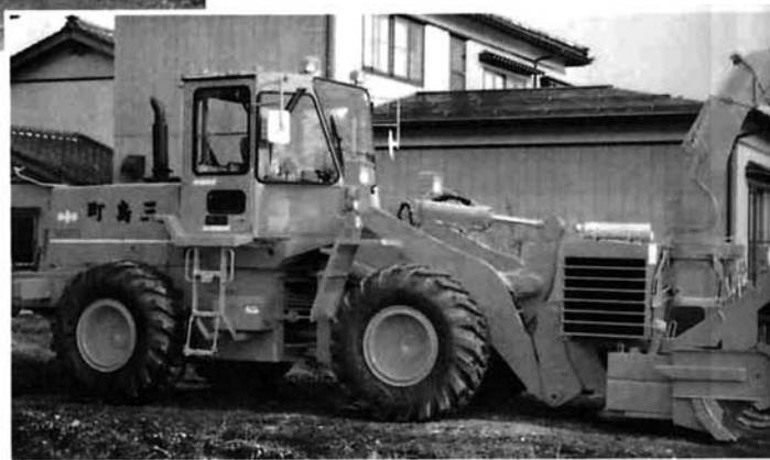
12t級車輪式ロータリー除雪装置付除雪車 ◆ 寸法 長さ 8.15m 幅 2.7m ◆ 性能 高さ 3.6m 最大除雪幅 2.7m 最大投雪距離 20m ◆ 価格 2,382万円

冬をむかえて、町に頼もしい助っ人がやってきました。この写真が助っ人のロータリー除雪車です。重さ15t、シュート(雪を吹きとばす筒)は折りたたむことができる上に、ワンタッチでロータリーをバケットや排土板に交換できるなどすぐれた機能を持っており除雪以外の作業にも利用することができます。この強力な助っ人は町内の主要な幹線道路などの除雪に出動することになっています。