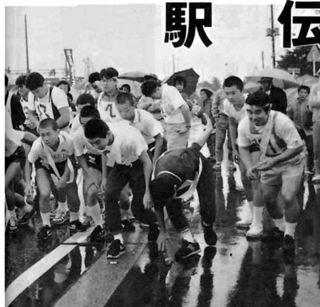
降りしきる雨について力強くスタート。 今年は中学女子もオープン参加しました。