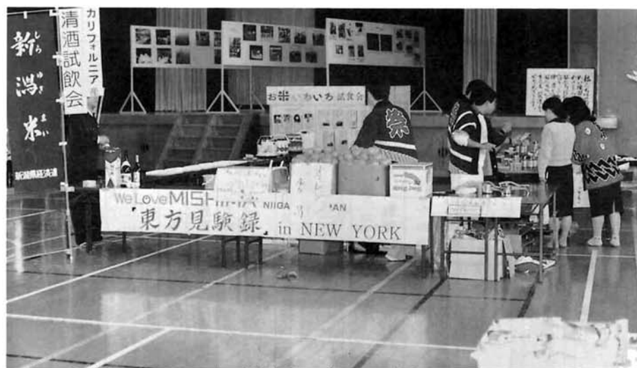
アメリカンフェアではアメリカングッズの即売 カリフォルニア米の試食会、牛の丸焼きなどで盛況。

前夜からの雷鳴に開催が危ぶまれた駅伝大会でしたが、練習を重ねた選手達の熱意が実施に向かわせました。