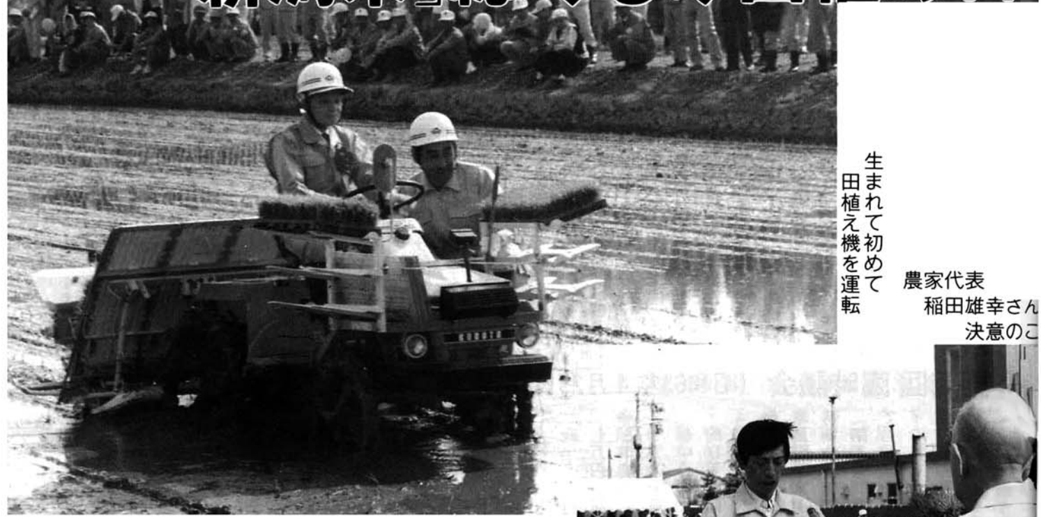
生まれて初めて 田植え機を運転