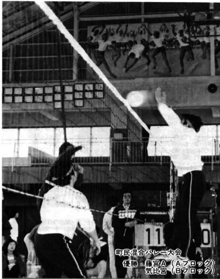
町民混合バレー大会 優勝 藤宮A (Aブロック) 気比宮 (Bブロック)

昭和61年12月15日 発行 新潟県三島郡三島町役場 ☎(0258)代42-2221 印刷 長岡市 総合印刷 KK中 越