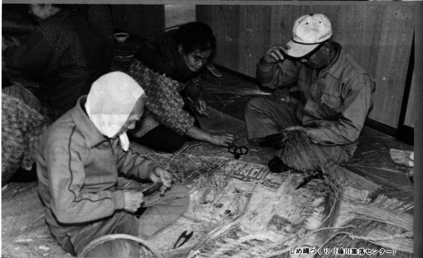
しめ縄づくり(藤川集落センター)