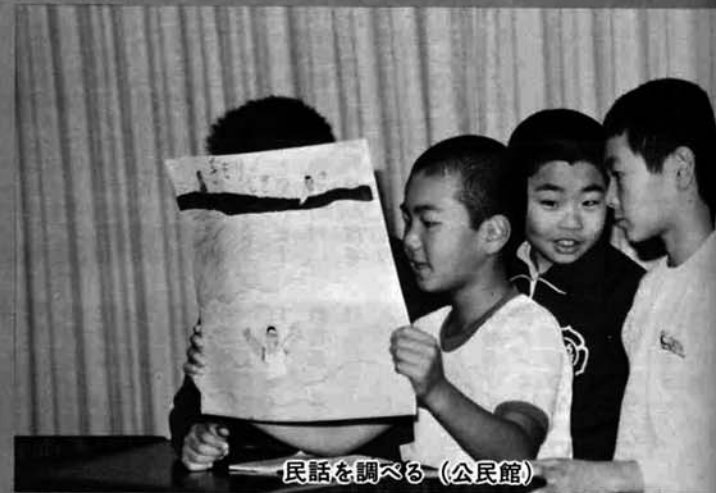
民話を調べる(公民館)