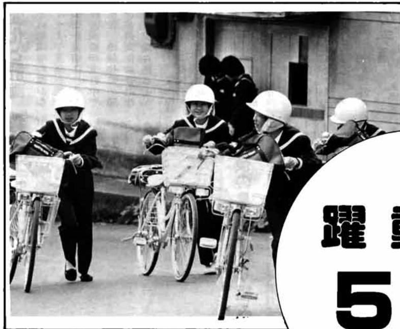
点検してもらった自転車に乗って元気に登校

昭和61年5月15日 発行 新潟県三島郡三島町役場 ☎(0258) (4)42-2221 印刷 長岡市 総合印刷 KK中 越