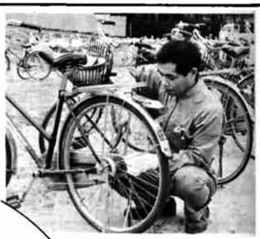
故障箇所はないか念入りに点検します。