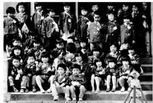
新入園児も新しい環境に慣れ、元気よく生活しています

野山を深くおおつていた雪も消え、木々は芽吹き、新緑が鮮やかに目に映るようになりました。 町のおちこちに新しい躍動が見られます。それらのいくつかをカメラで捉えてみました。