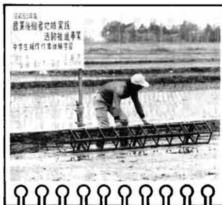
ゴロを押して苗を植える目印をつけます

もう三島町は初夏のたたずまいを見せはじめています。躍動の5月、そして夏も近くなっています。