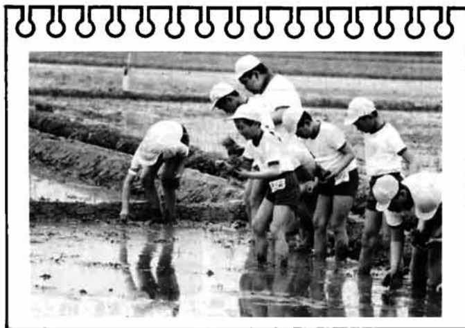
1株ずついねいに植えます