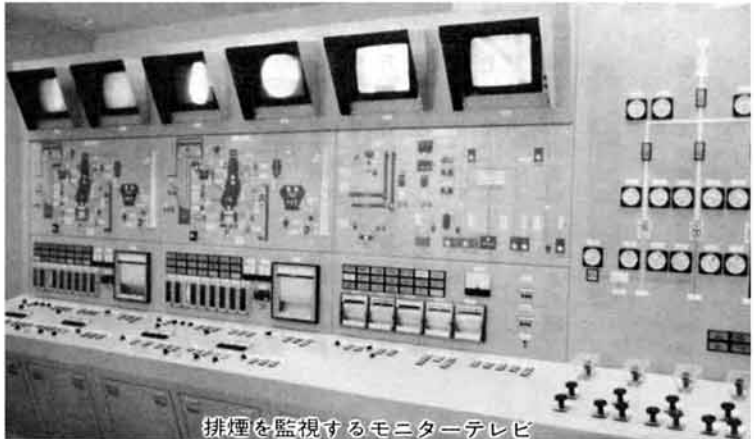
排煙を監視するモニターテレビ

59年春から進められていた長岡地区衛生処理組合(長岡市、三島町、越路町)のごみ焼却施設鳥越事業が完成し、3月28日竣工式が行われました。焼却炉には最新式の流動床式焼却炉(75'×2'炉=150')を採用しており、大気、騒音、臭気などの面に最先端技術の導入を図るとともに、コンピュータによる24時間チェック体制がとられています。近年、消費生活の構造的変化に伴い、ごみの量の増加と質の多様化が著しくなっていくなかで、この施設は、川西地区のごみを衛生的に、しかも運転費・維持管理費の軽減化を図るとともに、生活環境と公衆衛生の向上に期待されるものです。