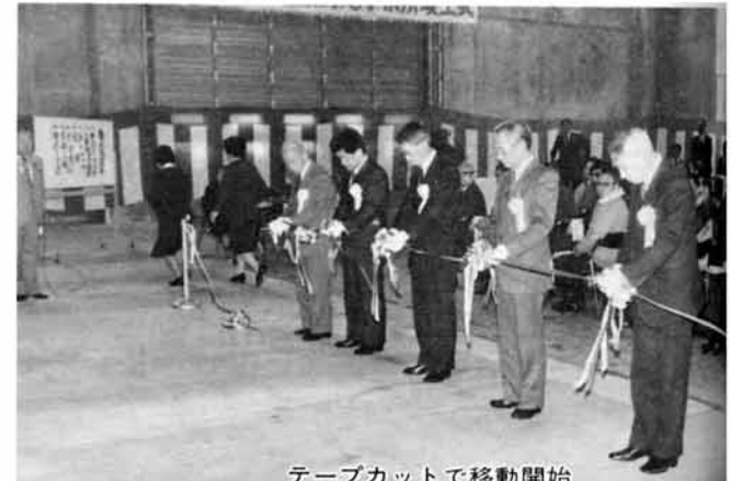
テープカットで移動開始