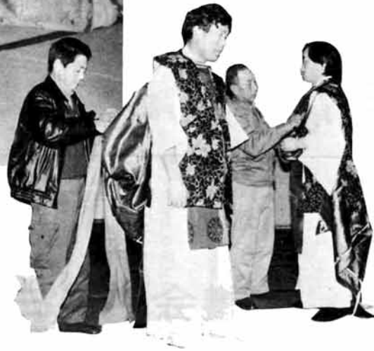
着付けはやはり先輩でないと...

一生のうち 約21年間を自由に使える 一生のうち、21年間、自由に時間を使えます」といわれたらあなたは どうしますか。 「いやそんなにいらぬのか?」それとも「それだけしかないのか?」と思いませんか。 実は、この21年間(約183、250時間)というのは15歳から平均寿命までの男女の自由時間の平均です。ここでいう自由時間とは、一日の時間の中から①睡眠、食事、良のまわりの用事などの「生活必需時間」、②仕事、学業、家事、通勤などに使われる「拘束時間」を引いた残りの時間のことです。 つまり、個人が自由に使える「余暇時間」ということです。はたして約21年間の余暇時間というのは多いでしょうか、少ないでしょうか。 もう少し細かく一年当りの余暇時間で見てみましょう。すると365日のうち、自由に使えるのは約110日間になります。睡眠時間などの生活必需時間を引いた時間ですから、多いように思いますが、いかがですか。