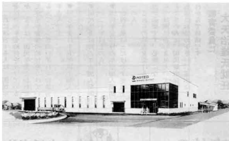
1月7日から操業開始される新工場

は技術的な方向が高度化、に進 むため、全て無人化を指向して おり、ユザーからの要求は、よ り多様化のニーズが増え大企業 では、対応出来ずアドテック・ エンジニアリングの様な技術集 団の企業が急成長しております。 会社でも、オランダに本社の あるASM社との業務提携に依 る新製品の開発、キャンソンの 共同開発等のプロジェクトも進 んでおり、立地する会社の前途 は、洋々としております。六十 年度の売上十三億円を目標にさ れており、六十一年には工場の 増設を計画し社員も増員し、地 元雇用を増したいとしています。