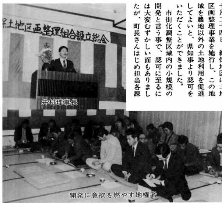
開発に意欲を燃やす地権者

市街化調整区域内の小規模の 開発と言う事で、認可に至るに は大変むずかしい面もありまし たが、町長さんはじめ担当各課