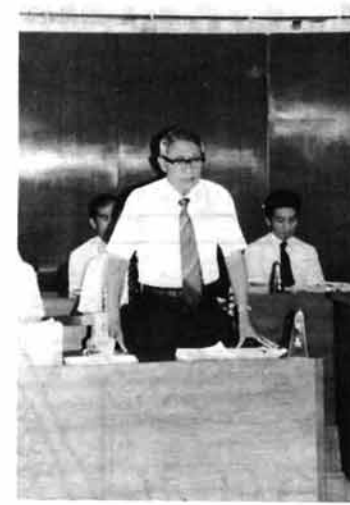
就任のあいさつをする新町長