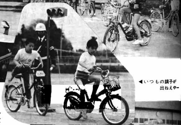
いつもの調子が出ねえや