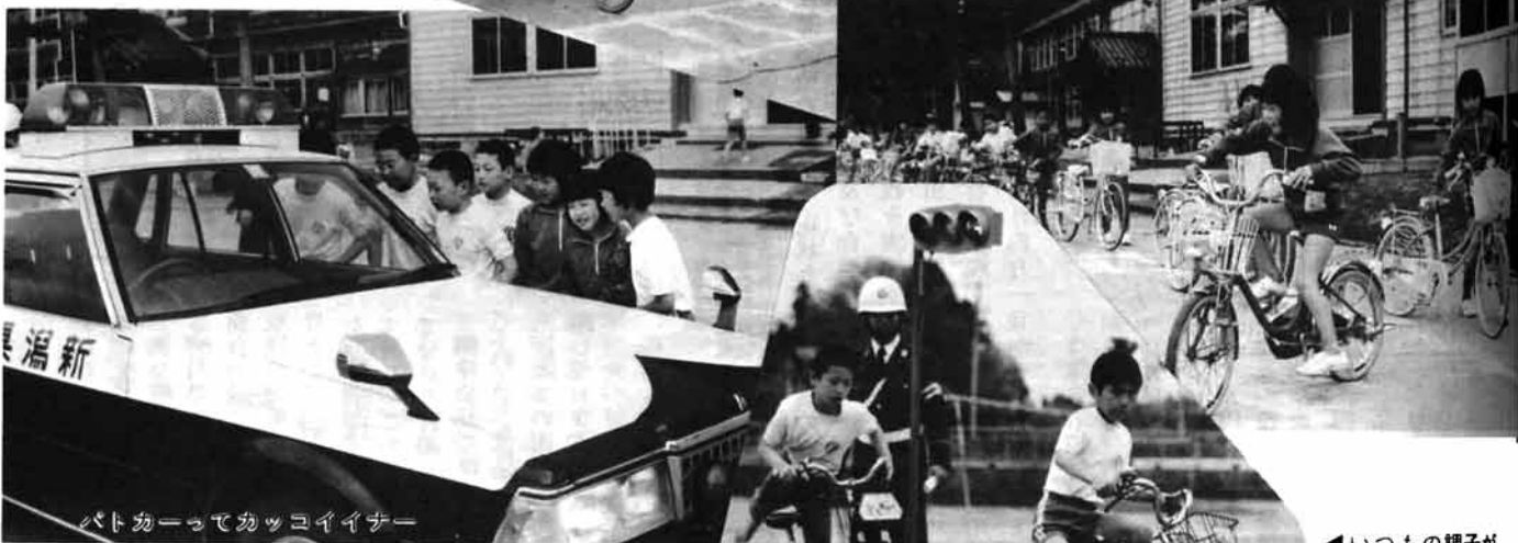
パトカーってカッコイイナ