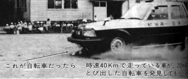
これが自転車だったら 時速40Kmで走っている車が、20mとび出した自転車を発見しても