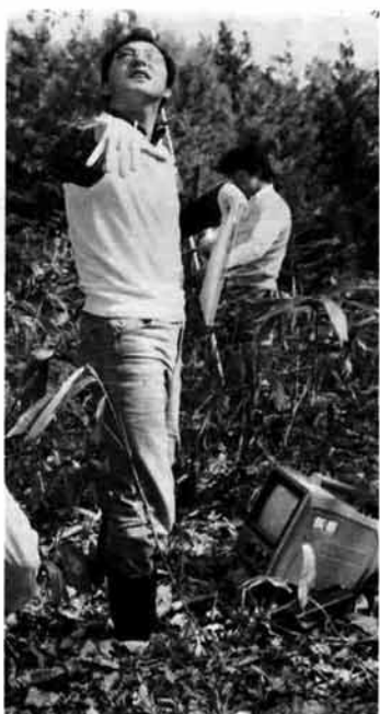
5月13日、電波探知機器を積んだNHKのサービスカーが現地に。

「このへんでいいでしょう」NHKの担当者の指示で、アンテナを立てて調べることに。