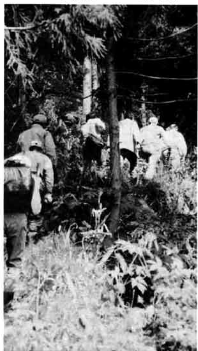
目的地を目指して登る山道 ——大丈夫か……の疑問も。