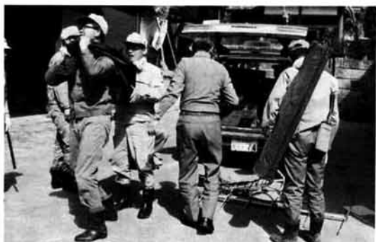
早速、村の人も手伝って「七つ道具」を背負って出発準備。