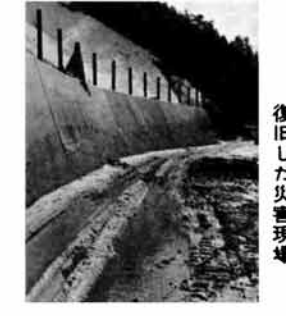
復旧した災害現場

選挙啓発の標語募集 県選挙管理委員会では、明るく正しい選挙を進めていくために、投票参加、正しい選挙、金のからまない選挙に関する標語を募集しています。特選三句に各三万円、秀 七か月ぶりに全線開通 長岡出雲崎線 昨年の災害以来不通となっていた長岡出雲崎線の中水地内の復旧工事が終了、二月五日、約七か月ぶりに全線が開通しました。 中水地内の災害箇所は、約六千立方メートルの土砂が約百メートル幅にわたって擁壁を押し倒して流出、道路を封鎖していたもので、今でも崩れ落ちた山はだが当時の生々しさを物語っています。