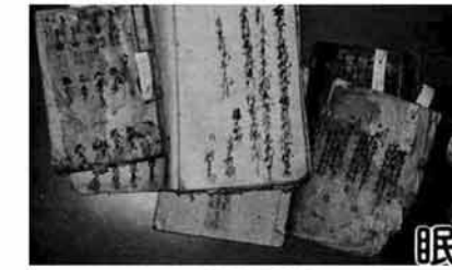
眠っていた貴重な古文書類

「まだまだ、各家庭のどこかに貴重な資料が眠っているはず」、「今日、明日とは言わないが、ぜひ一度探してもらえんどうか」と、会う人ごとにたずねているのが、本格的活動を始めて二か月を経過した町史編纂委員会のみなさん。