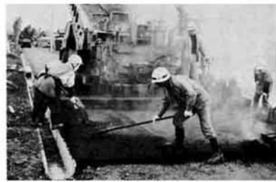
今年度第1号の舗装工事（鳥越）

町道早くも完了路線 越・宮本線など工事がほぼ完了した町営ガスの区域拡張は、今月中にも認可がある見込みです。先ほどまとまった新しい供給区域の加 た路線もあります。 町道の整備はこのほか、大字が基準に合った改良、拡幅工事を単独で行う場合にもその工事費の半額を町費補助する方法もとられています。この方式による町道整備が藤川、瓜生など六字で実施される予定です。 なお、町が要望していた公共土木関係工事もほぼ決まり、主なものには、与板原線富沢地内の残された区間の改良工事、脇野町、七日市地内の消雪パイプ工事や新保地内の歩道工事などがあり、このほか果が単独で行う「県単事業」も数か所で行われる予定です。