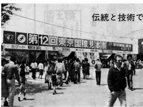
伝統と技術で売り込む

町道早くも完了路線 越・宮本線など工事がほぼ完了した町営ガスの区域拡張は、今月中にも認可がある見込みです。先ほどまとまった新しい供給区域の加 た路線もあります。 町道の整備はこのほか、大字が基準に合った改良、拡幅工事を単独で行う場合にもその工事費の半額を町費補助する方法もとられています。この方式による町道整備が藤川、瓜生など六字で実施される予定です。 なお、町が要望していた公共土木関係工事もほぼ決まり、主なものには、与板原線富沢地内の残された区間の改良工事、脇野町、七日市地内の消雪パイプ工事や新保地内の歩道工事などがあり、このほか果が単独で行う「県単事業」も数か所で行われる予定です。