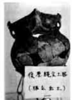
根立遺跡から出土した土器

千石原遺跡に続いて、昭和四十七年四月二十三日、上岩井と七日市の境の黒川右岸地点で、中村孝三郎氏指揮のもとに緊急発掘調査が行われた。 ここは、三千六、七百年ほど前の縄文後期時代に属するもので、高坏(たかつき)注口、かめ形、はち形土器と少量の石器が掘り出された。珍しいのはトチの実の皮やクルミの実やからなどの植物性