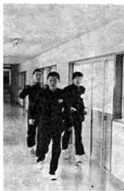
体育館への渡り ろうかも完成

本校舎と体育館を結ぶ連絡通路が、各クラブ室など最終的な附帯工事(十二月十二日完成)も終わった三島中学校を訪ねて半年を経過した新校舎の感想を聞いてみた。 一番多くの声は「明るくてとてもいい」というもの。旧校舎の採光の悪さは評判。とるはどだったから、生徒たちにとっては何よりもいいところのひとつだ