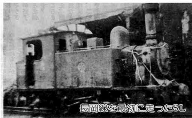
長岡線を最初に走ったSL