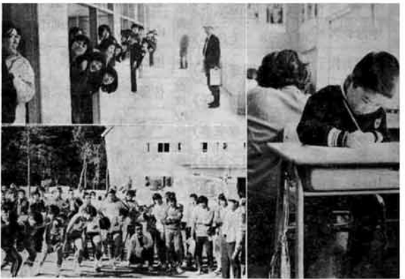
写真 ① 傍聴も真剣 (三月定例議会) ② 水を送れ (昨年の消防秋季演習) ③ ④ 並ばせて何してくれるの (日吉小知能テスト) ⑤ こんな学校ならもっとよくできたんだ (卒業生が新校舎を見学) ⑥ スターの時は皆いっしょ (町中を熱狂させた駅伝大会) このように多くのお金を使って町は運営されます。町民ひとりひとりのみなさんの積極的な意見、ご要望がさらに明るく町づくりに役立ちます。町政全般についてのご意見をお気軽にお寄せくださるようお願いいたします。

特別会計 国保会計では、助産費が四万円に、育児手当も月額千円に増額されました。 予算の総額は一億四千二百五十二万三千円、前年度に対して五十四パーセント伸びました。医療費給付はそのうちの八十一パーセント、実に一億一千五百万円にもなっています。これは昨年の二度にわたる医療費の引き上げとともに診療の増加も大きく原因しています。 そのため、保険料も相当の増額が見込まれます。ひとり一人の国保に対する理解が望まれます。水道及びガス事業会計では、製品売上げをそれぞれ、約二千九百万円、二千九百万円見込んでいます。大きな工事としては、年々増加する水道の需要に対処するため本年度、新しい井戸を掘る予定で準備を進めています。 工事資材などの高騰のため、水道の新規加入者から五百万円の加入金を負担いただくことになりました。ご理解をお願いします。