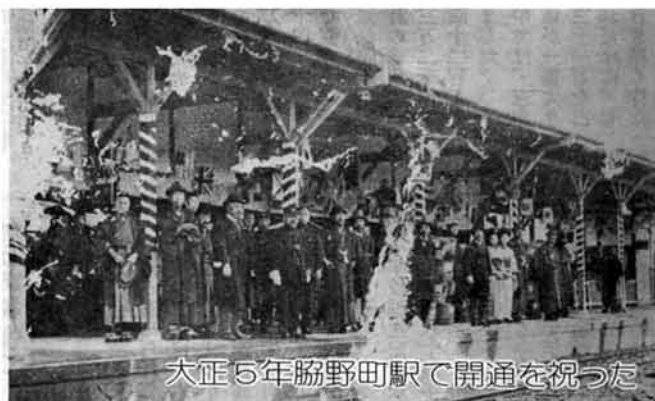
大正5年脇野町駅で開通を祝った

緑がどこまでも続く田んぼ ただ走る使命に燃えて かえるの声を聞きながら 堂々と、走り続けた ゆっくり、走り続けた 小さな箱の中で小さな恋も こがねの波打つ静かな里を 悲しみの別れも乗せて 小さな川、大きい川もゴトゴト 静かに、走り続けた 黙々と、走り続けた 今、終った 自分の道もわからない白い世界 みなさん、さようなら