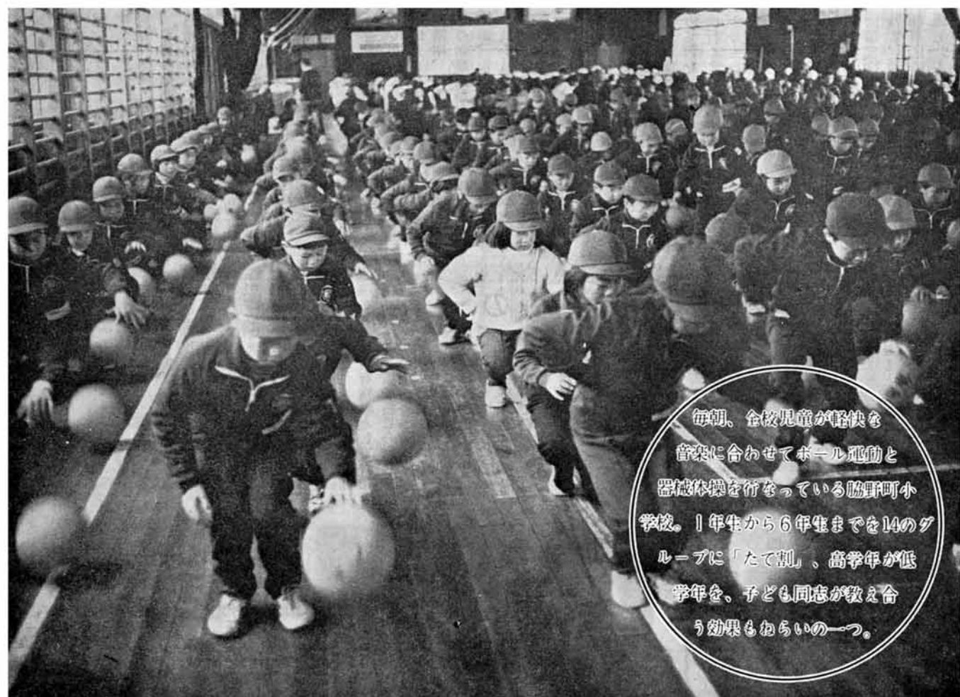
毎朝、全校児童が軽快な音楽に合わせてボール運動と器械体操を行なっている脇野町小学校。1年生から6年生までを14のグループに「たて割」、高学年が低学年を、子ども同志が教え合う効果も面白い。

発行 昭和49年5月15日 新潟県三島郡 三島町役場 TEL. 脇野町局 局番 025842 内 2 2 2 1 印刷 北越印刷株式会社 長岡市福住1丁目 TEL. ☎ 0306