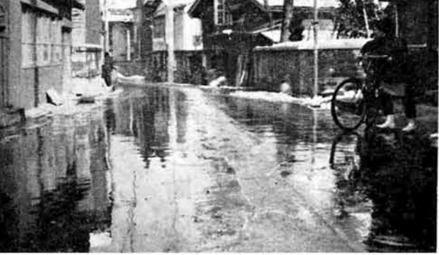
冬将軍に備え吉崎地内消費パイプ完成

ねずみ算は、繁殖力のおう盛のことから「ねずみ算」といわれる和算がありますねずみ年ゆえ、ねずみ算にちなんで、預金をする年にしてはいいが、どうでしょう。ちなみに、今日一円の預金をし、明日は二円にと、前日二倍ずつ預金を続けると二十日間の預金高は、なんと百四万八千五百七十五円にもなります。 「ねずみ算」のように目標をもって励行すれば、目的は達せられると思いませんか。(生活係)