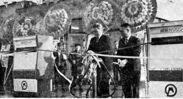
農協も広域事業 昭石三島郡中部農協給油所(三島町大野)開所式(盛野町・大津・与板・黒川の四農協)

ねずみは、繁殖力のおう盛のことから「ねずみ算」といわれる和算がありますねずみ年ゆえ、ねずみ算にちなんで、預金をする年にしてはいいが、どうでしょう。ちなみに、今日一円の預金をし、明日は二円にと、前日二倍ずつ預金を続けると二十日間の預金高は、なんと百四万八千五百七十五円にもなります。 「ねずみ算」のように目標をもって励行すれば、目的は達せられると思いませんか。(生活係)