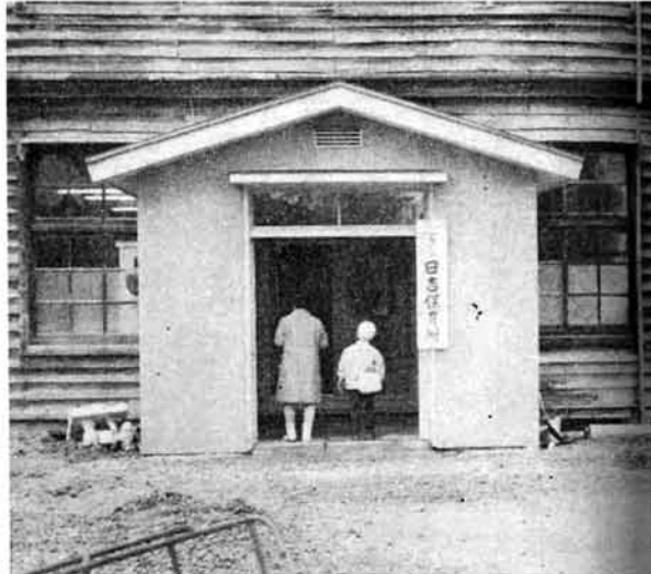
(お母さんとともに)