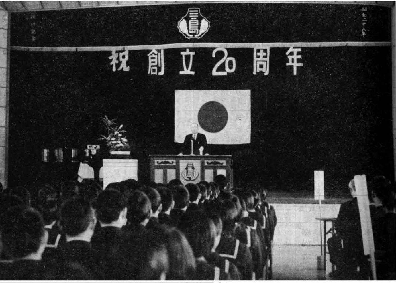
盛大だった記念式典