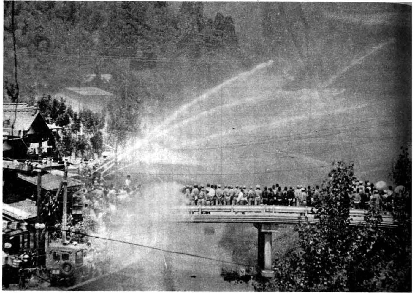
雄壮な放水演習 小木城川畔

発行 昭和45年6月15日 新三島町役場 TEL 340 (代) (夜) 印刷 北越印刷株式会社 長岡市福住1丁目 TEL (3) 0306