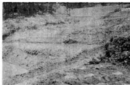
災害復旧完了（逆谷大沢）