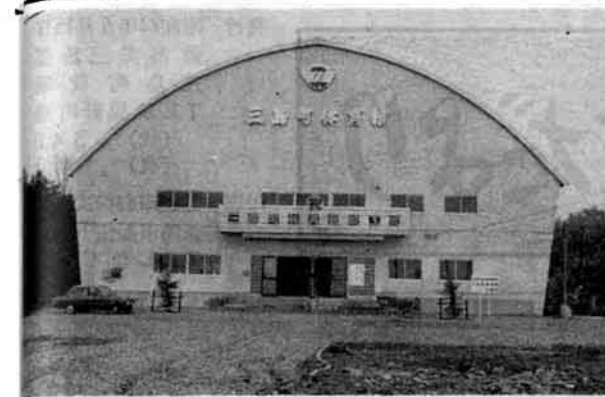
完成した三島町体育館

四十三年度に計画された国や県にたよらなければならぬ財源の占める割合が大きくなっていきます。 計画された各事業完了 四十三年度に計画された事業はすべて予定どおり完了しました。 中でも体育館の建設には約五千八百万円（うち一般財源約二千百万円）が投入され去る三月十七日立派に完成しました。 多額の費用を投じて建設の