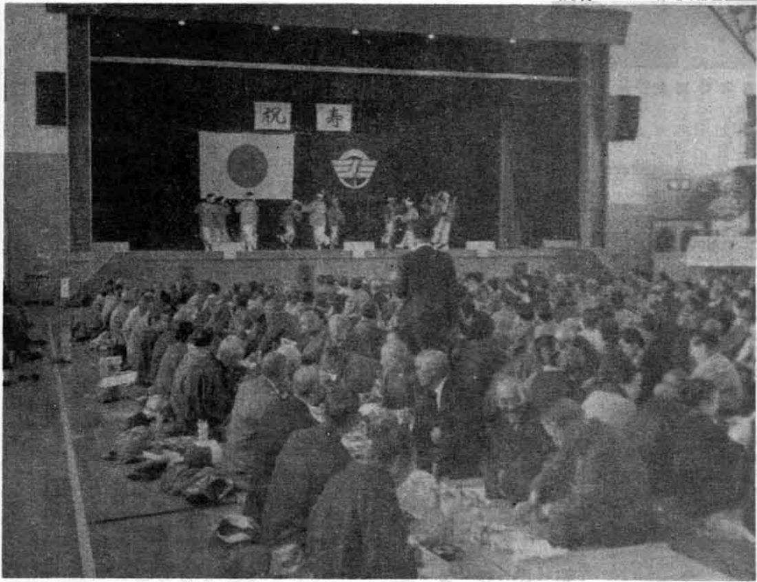
(なごやかに盃交わす老人と婦人会の踊り)

四月二十八日、新築完成の三島町体育館にこのよるこびは先ずお年寄りからと、各部落別におこなわれた敬老会を全町一堂に招き、盛大におこなわれた。この日、招かれたお年寄りは七〇歳以上四九七人、心配された天候も、うららかな春の日もやわらかに定刻の九時三十分をまたがず子や孫に手をとり、元気な足どりで続々と集まられ、ほほえましい姿が見受けられた。