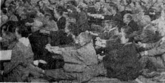
長寿健康体操をする老人

このころで三月十五日の三島町に、「ひそやかな老人の願い」と題する一文が、はからずも町長さんのお考えと一致したか、早々にこの堂々たるマンモス体育館の完成とともに、恒例のような集いにふさわしい話易い老人にあくびの一つも、三島町に呼びかけられたの、今年、まず、開口一番、皇后様と、さすがに大きな講が、都市三島町だ