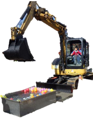
ショベルカーでヨーヨー釣り