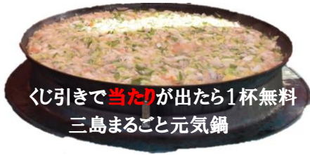
くじ引きで当たりが出たら1杯無料 三島まるごと元気鍋

食べて美味しい♡遊んで楽しい! イベントが盛りだくさんです! ぜひ皆さんで遊びにきてください♪