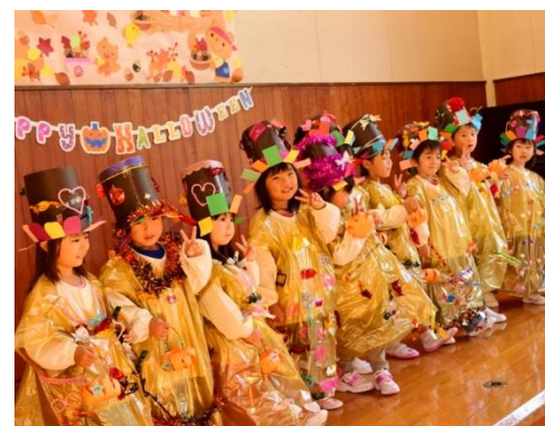
● 10月24日(金)みしま北保育園 お菓子くれなきやイタズラするぞ！

三島地域の各地区で防災訓練が実施されました。自主防災会が中心となって避難訓練や救護訓練などに取り組みました。災害時、隣近所で助け合えるよう日頃から防災意識を持ちましょう。