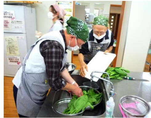
● 10月17日(金)みしま会館 男子、家族のために料理を作る

三島公民館が「合併地域を知る講座～中之島を知ろう～」を開催しました。大竹邸記念館や鞍掛神社などを巡り、郷土の歴史や文化を学びました。昼食は農家レストランで地元野菜に舌鼓♪