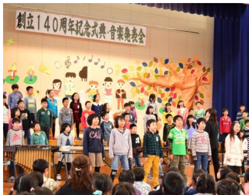
● 11月1日(土)脇野町小学校 三世代の学び舎に歌声響く

みしま南保育園の園児が、クリーン作戦に挑戦。園のまわりの農道や歩道に落ちているゴミを一生懸命拾いました。「ゴミが落ちてるとかない」「道がかわいそう」など、やさしい声が聞かれました。