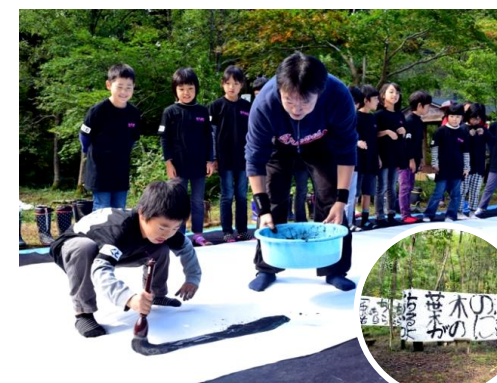
● 10月14日(火)日吉小学校 三島の森に美術館が登場

長岡市消防団三島方面隊の秋季消防演習が実施されました。地域の防災リーダーとして、住民の安心・安全を守るという重要な役割を果たすため、早朝から放水訓練などに取り組みました。