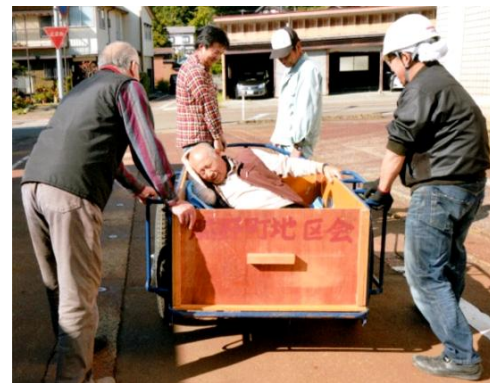
● 10月19日(日)三島地域 水害・地震：もしもの時に備えて

支所と社会福祉協議会が介護研修会「男子厨房に入ろう」を共催しました。包丁を握る手は真剣そのもの。「夫婦どちらかが介護する時がきたらお互いさま」など、参加者同士で交流ができました。