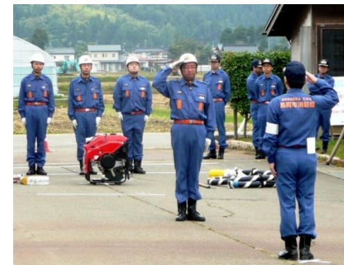
● 10月5日(日)脇野町小学校 地域の安全を守る防災リーダー

長岡市消防団三島方面隊の秋季消防演習が実施されました。地域の防災リーダーとして、住民の安心・安全を守るという重要な役割を果たすため、早朝から放水訓練などに取り組みました。