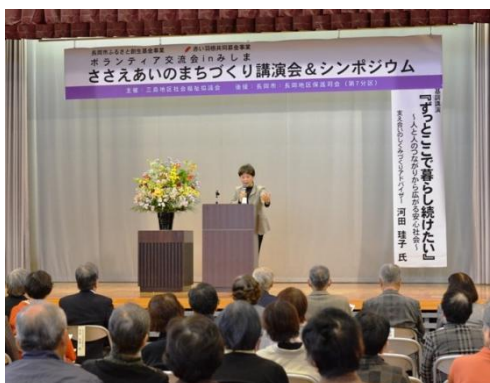
● 11月9日(日)みしま会館 三島での暮らしをささえあおう

上岩井町内会が「ブナ林秋のコンサート」を開催しました。110人が会場を訪れフルートとチェロのやさしい音色と脇野町小学校3年生の軽やかな演奏に、心地よいひとときを過ごしました。