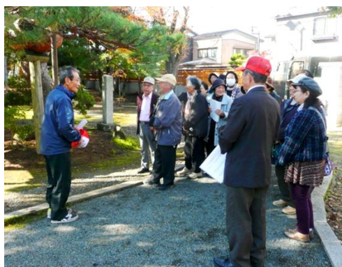
● 11月6日(木)中之島地域 ロマン感じる中之島歴史探訪

脇野町小学校が「創立140周年記念式典・音楽発表会」を開催しました。創立から現在までの校舎の様子が映し出されると会場からは懐かしいとの声。三世代で140周年をお祝いしました。