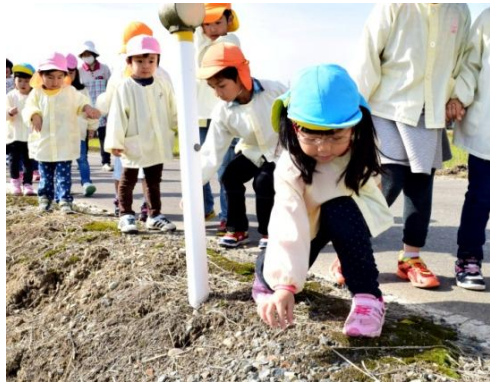
● 10月31日(金)みしま南保育園 ゴミ、捨てないでください！

三島地区社会福祉協議会が「ボランティア交流会～ささえあいのまちづくり講演会&シンポジウム～」を開催しました。登壇者の体験談に、参加した120人の中には涙をぬぐう人の姿も見られました。