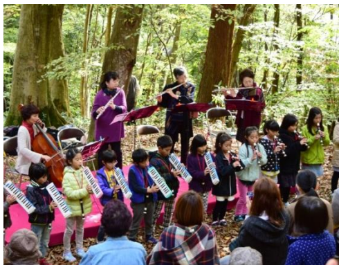
● 11月8日(土)上岩井地区 ブナ林の木漏れ日のなかで：

みしま観光推進協議会が「上越市／高田開府400年視察研修会」を開催しました。参加者は高田城や城下町のまち並みを見学し、住民による地域の魅力づくりや全国への発信方法を学びました。