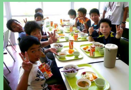
〈みしまジュニアリーダー研修の様子〉