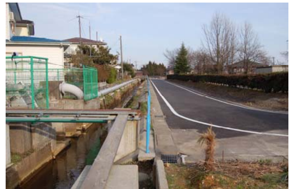
▲脇野町地区浸水対策