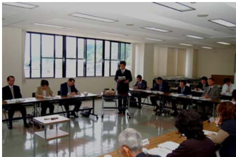
三島ライトアップ実行委員会による プレゼンテーション

また、分科会の設置について協議し、2つの分科会を設置し、委員構成を決定しました。