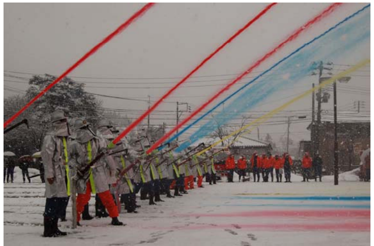
無火災、無災害を願い一斉放水

また、式典終了後、雪が降りしきるなか、三島支所駐車場において、今年一年の無火災・無災害を願い、一斉放水が行われました。