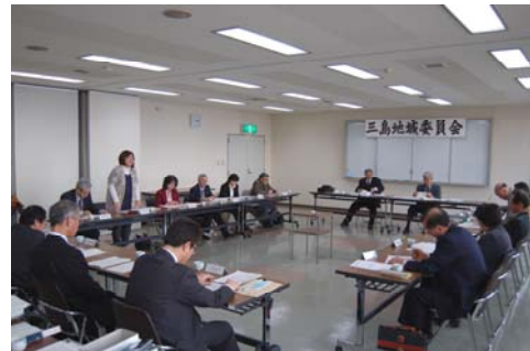
ふるさと創生基金事業について審議

ふるさと創生基金事業実行委員会から提案のあった事業について、事業内容を承認しました。