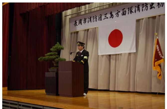
方面隊長による訓示