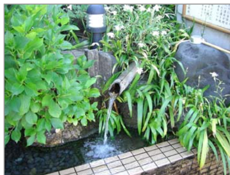
縄文雪つらの水(脇野町)