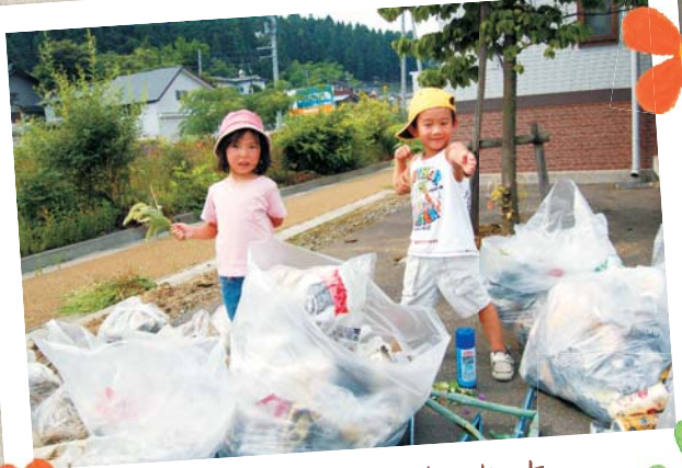
お手伝いがんばったよ (7月27日・上岩井環境保全活動)