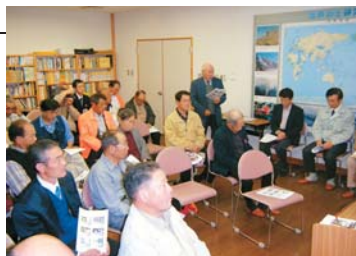
板倉での交流会の様子