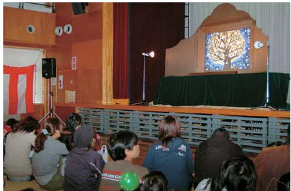
絵本・紙芝居作家 諸橋精光さんの実演 (11月3日・大型紙芝居公演)