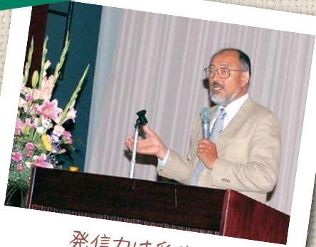
発信力は受信力 (7月27日・みしまコミュニティ講演会)