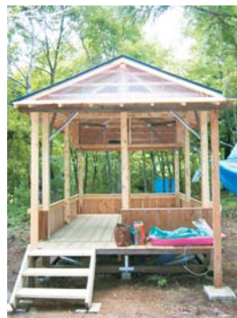
全て手作りの東屋