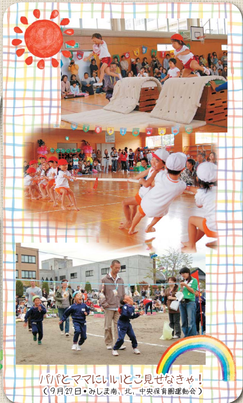
パパとママにいいところ見せなきゃ! (9月27日・みしま南、北、中央保育園運動会)