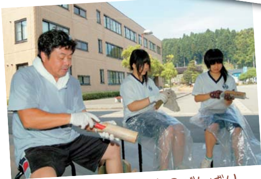
まつりを支える裏方のがんばり (8月3日・三島まつり用竹灯ろう作り)