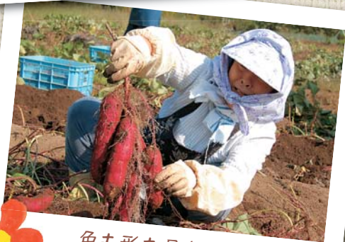
色も形も最高級! (10月9日・七日市福祉会)