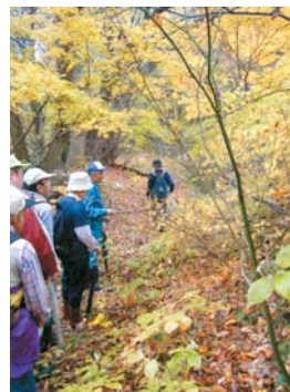
里山の達人が草木や木の実などを説明