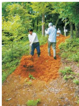
学校林内に木皮を敷きました