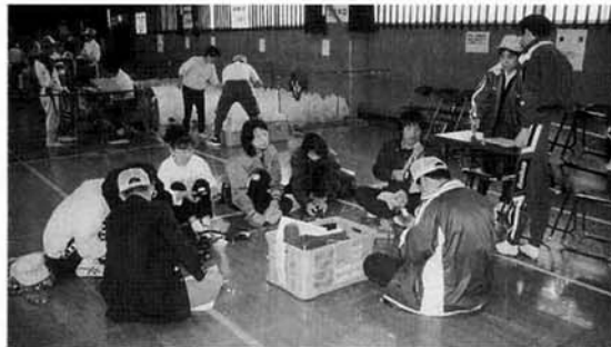
▲西山連峰登山マラソン大会 競技役員として