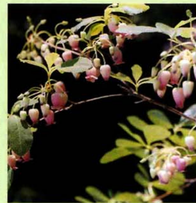
撮影日 一九九一年五月二〇日 場所 鳥越字城山 (写真・文 奈良場正二)