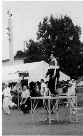
▲町民体育祭 大会係員として

その他にも ●町民混合バレーボール大会の競技役員 ●町民綱引き大会の競技役員 ●親子スキー教室の引率スタッフ ●雪上運動会の競技役員 ●各種研修会への参加 ●体育指導委員会への参加 などでも、活躍しています。 このように「体育指導委員」は、町の生涯スポーツの推進に欠かせない存在なのです。