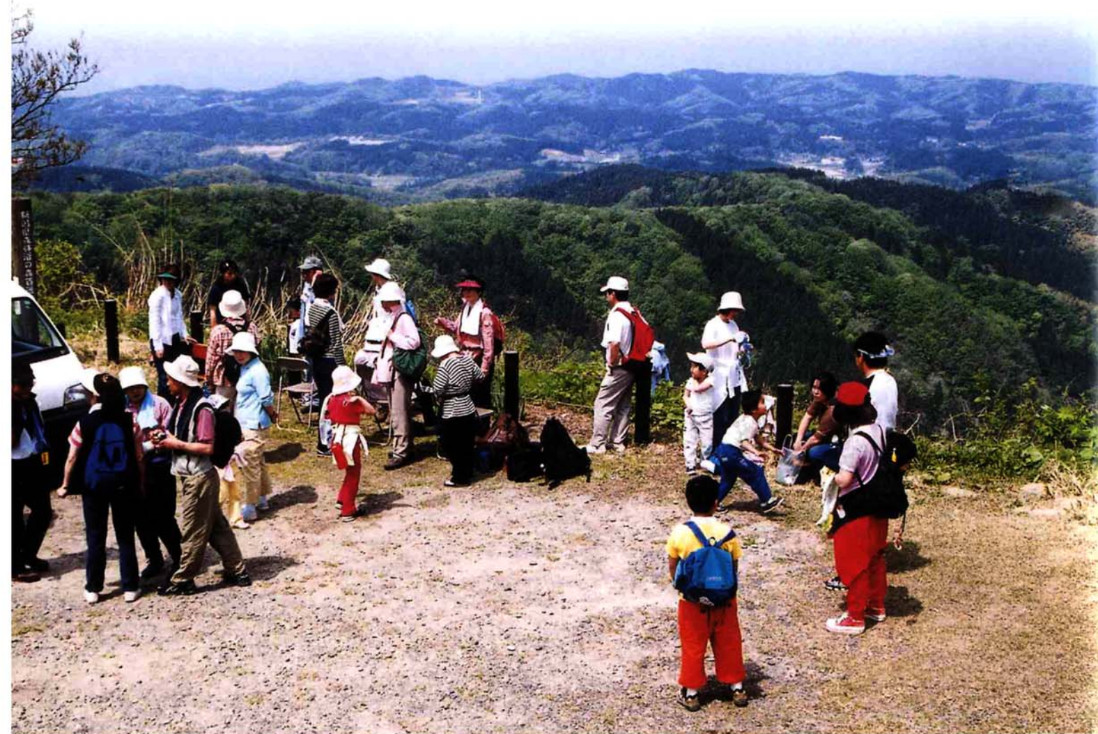
▲5月6日、西山連峰ハイキング