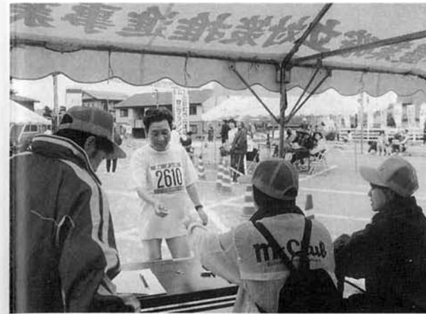
◀西山連峰 登山マラソン大会 競技役員として