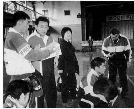
▲町民駅伝大会 競技役員として