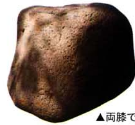
▲両手で抱えるためか 緩やかにくぼんでいる

ガス企業団 ☎42-2671 水道企業団 ☎72-2259 みしま中央会館 ☎42-2222 与板郷消防署(斉場) ☎72-2572 みしま交流センター ☎42-2223 三島町体育館 ☎42-2756