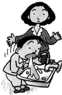
三島町健康な歯づくり推進委員会