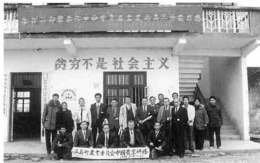
~古い公民館風~ 廟嶺郷塔山公所

時間を要しましたが、当町と巻町までくらの感じでした。途中の農村風景ですが、れんが造りの家が多く、道路に面した家は現代的でしたが、その外は農家特有の家のような感じ。墓地も点在し、道路端の至るところで農産物の売買のたまりが目につきました。私が見たものはザリガニ、アヒル、卵等々でした。