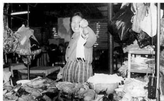
小動物は生きたまま市場で取引

夕食後、一路視察先である桂林に香港から国内航空で約1時間、10時過ぎ桂林空港に到着いたしました。空港から約1時間、出迎いの通訳と旅行社の車でホテルに直行。あたりは暗く、日本だったら電気の方がいたるところで見えることを考えると、「さすが広いな」という感じでした。2月というのにしかも午後11時ころなのに、市内は人と自動車にぎわっていました。日本と比べると、交通ルールは相当緩和されているように思いました。この日、長かった1日はツインベットでおやすみ