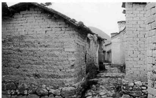
レンガ造りの多い郊外農村地帯

さて、肝心の農業視察であります。中1日において20日午前中に行いました。場所は桂林市郊外の農村地帯で、中心部より車で約90分くらいのところになりました。道路状況が悪いので