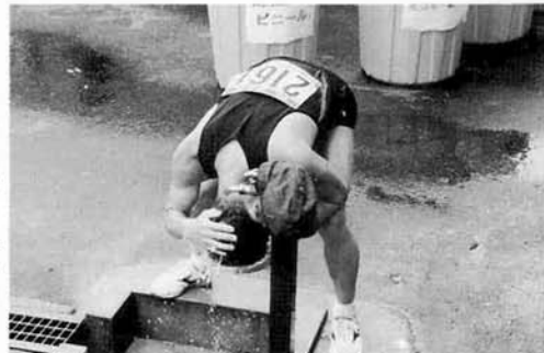
フィニッシュのあと