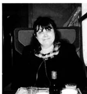
ロンドンからパリに帰る女性（ユーロスター車中）

異質性。ロンドンのいたるところで見た建物の外壁等の補修工事。また、車の頑丈さ、運転手の優秀さにより世界一安全だといわれ、かぶと虫のような古めかしいスタイルを頑なに守るロンドンのタクシー。手動式で自分でドアを開けて乗り、料金の支払いを車を降りて助手席から窓越しに払う……。古くてもよいと思うものは大切に保存し、その古さを守り抜こうとする努力と心根を強く感じました。