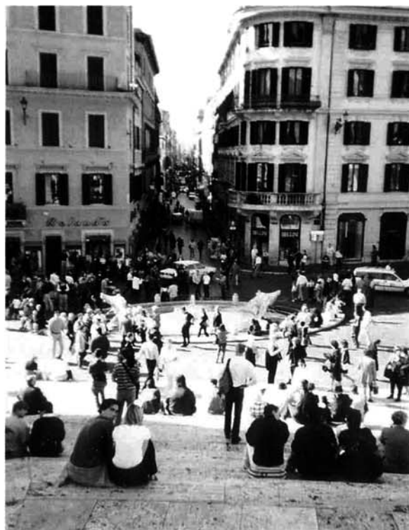
帰途前日の午後、最初で最後のまとまった自由時間をもらいました。荷物の整理をし、ホテルから歩いて15分のスペイン