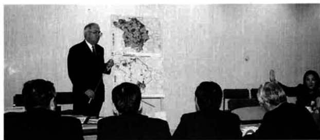
計画的な都市づくりについて研修 (ミルトン・キーンズ：ロンドン郊外のニュータウン)