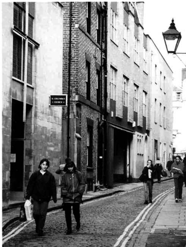
カレッジ内の石畳の小路を歩く学生（オックスフォード）