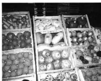
パリ近郊のランジス総合市場の野菜・果物