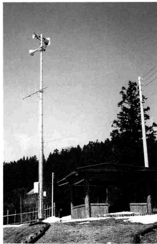
屋外受信拡声装置（屋外子局）