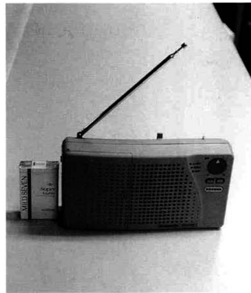
戸別受信機（戸別子局）

寸法 幅24cm 高さ13cm 奥行7cm 重量 約1kg (乾電池、コード除く) 消費電力 AC7W