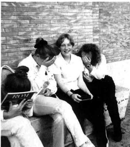
写真を撮り合ったローマっ子（バチカン市国）