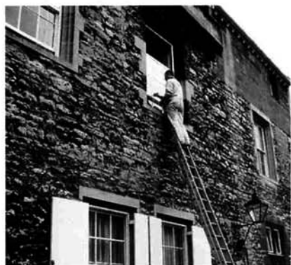
窓枠に白いペンキを塗る職人さん（オックスフォード）