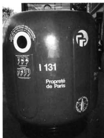
ビンなどの不燃物のごみ箱 (パリ市内) パリでは、ごみ箱・清掃車・ 清掃員の制服が緑色に統一されています