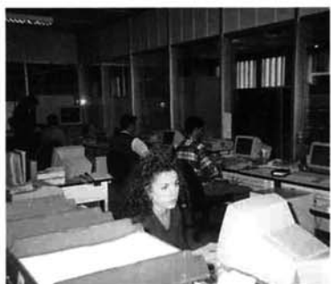
ローマ郵便局電子メールセンターにて