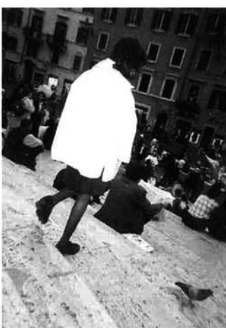
鳩と少女（スペイン階段）

広場へひとりで行きました。ここがなぜ気に入ったか。写真やTVで見たことのある場所だから、映画「ローマの休日」で有名だから、階段に座って見る景色がよいから。みんなそのとおりですが、一言でいうとその場の雰囲気、うまくいえませんが、ざわざわしてはいるが、決して騒音まではいかない「喧騒」の中に自分が溶け込めたと思ったからです。おしゃべりしているカップル、読書している女性、家族連れ…… 多分、いつも一緒に団体行動に疲れて、ひとりになった解放感、気安さ。見ず知らずの他国の人の中に埋もれて、その人達と過ごす時間と場所の共有感。ここにいる自分は何者でもない本当の自分、素の自分に戻れたと思ったからだと思えます。 小一時間ばかり、階段に座ってぼーっとしたり、ビデオを撮ったりしてました。スペインのカタロニア地方から来た若いカップルとあいさつしたり、ドイツ人のおじさんとビデオを撮り合ったりす