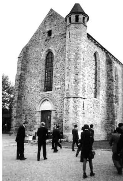
内部の改造、補修を行い地域のコミュニティセンター等として利用されている、昔は修道院だった建物（パリ郊外）