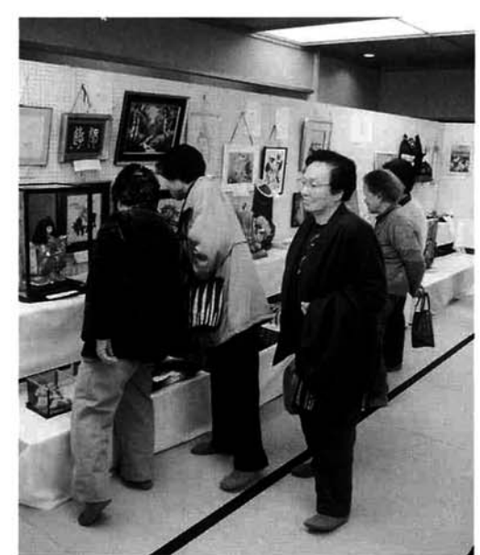
三島町高齢者作品展(3月13日・みしま交流センター)では、丹精込めて作られた生きがい講座生の作品が展示されました。

福祉活動等に意欲と情熱のある概ね60歳以上の方が対象です。 ▽講座の種類 基礎学習課程 福祉ボランティア講座 ワープロ講座 ▽学習期間 平成9年6月~10月まで ▽受付期間 4月1日~4月25日まで 詳しい内容は福祉課まで 初心者社交ダンス講習会のご案内 フラミンゴ・ダンスクラブ ☎42-3082 初心者を対象にした社交ダンスの講習会を開催します。