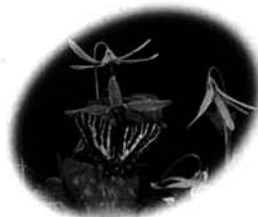
人気の高い「カタクリ」の名刺

企画調整課 内線323 木々や草花が芽吹き始める春は転動や異動の季節。町オリジナルの新しい名刺で、自分と三島町をアピールしませんか。 企画調整課では「蓮花寺の大スギ」、町の花「カタクリ」