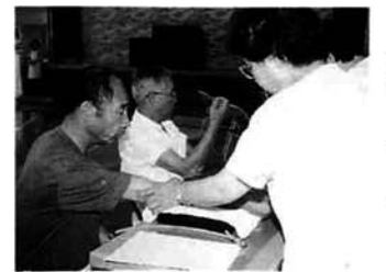
健康診査をすすんで受け病気の 早期発見につとめましょう

ほかの健康保険に加入し ても、手続きをしないと国 保を脱退したことになります。 また、二重加入となります。 また、やめる届出が遅れ ると、あとで給付を受けた 医療費を返さなくてはなり ません。 異動があった日から、14 日以内に届け出しましょう。