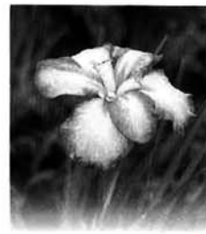
第 340 号