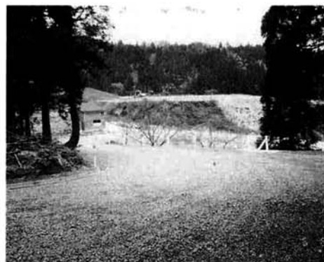
改良工事中の公園南線(県道中永宮本線一七社宮間)は大杉公園、マラソンロードへの乗り入れ道路となります。

21日、日曜日の10時、精鋭ランナーが町体育館前を一斉にスタートします。沿道からの熱い声援をお願いします。