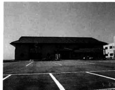
本年郷土資料館が内部整備され、歴史・文化会館としての機能を持つ中央会館。