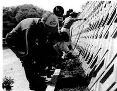
地域づくり基金の運用益は、花いっぱい運動など、町おこし活動の助成に使われています。