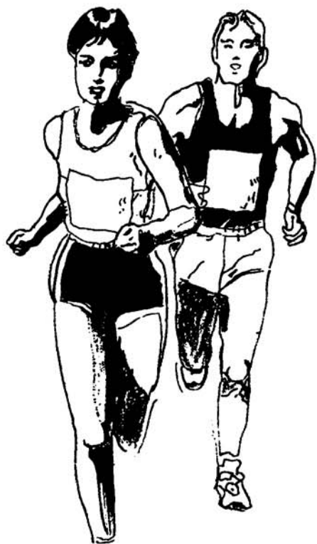
合併40周年特別企画