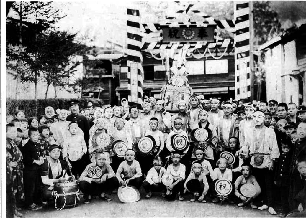
志田町交差点付近