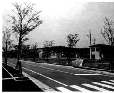
みしま中央団地内の幹線道路脇の街路樹。新芽がふきだし、新しい町の息吹を感じさせます。