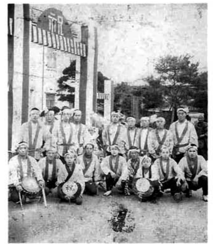
旧役場庁舎前で

昭和9年11月1日、「脇野町村」が町制施行により「脇野町」と改称されました。脇野町「若葉組」の面々は、3日、その祝いと皇太子殿下(現在の天皇陛下)誕生祝いを兼ねて、町の特産品を乗せた神輿をかつぎました。若葉組とは当時、数多くあった鍛冶屋で働いている若者たちの集まり。吉崎神社から脇野町志田町交差点、旧役場庁舎から白山神社と、町内を練り歩きました。