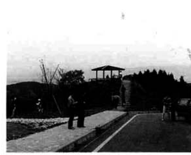
ゴールデンウィーク期間中、大勢の人が訪れた西山連峰マラソンロード扇城台付近。