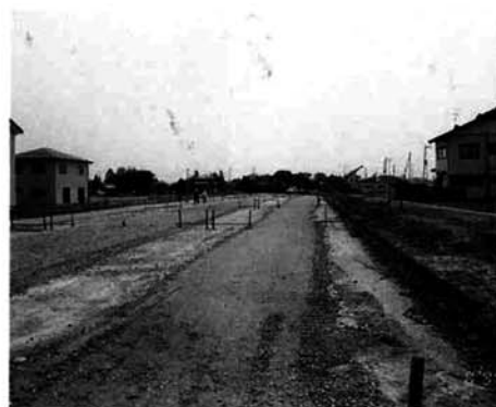
春から本格的な工事が始まり、輪郭が見えてきた中央公園。来春には、市街地中心に位置する町のシンボルの公園が完成します。