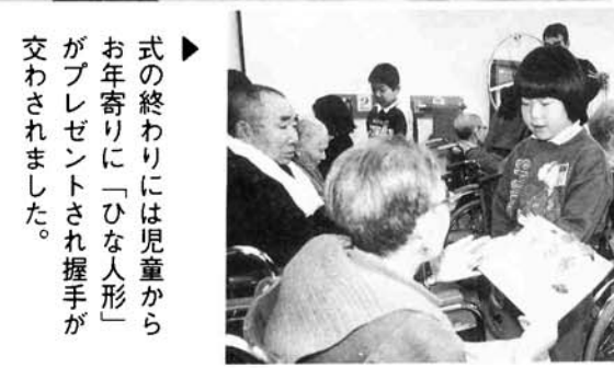
式の終わりに「ひな人形」がお年寄りにプレゼントされ握手が交わされました。