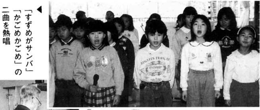
「すずめがサンバ」「かごめかごめ」の二曲を熱唱