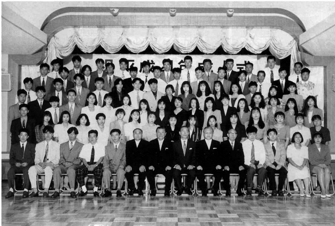
お盆恒例の成人式が、交流センターを会場として行われました。対象者は昭和46年4月2日から昭和47年4月1日までに生まれた方。ふるさとで成人式を — の帰省組を含め、83名が参加。背広やワンピースといった正装や夏らしい軽装など、思い思いの服装をした新成人は、久しぶりにあった友人と楽しそうに話を弾ませていました。

将来は英語の先生か、英語を生かせる仕事に。今までなかった権利と義務、しっかり果たしていきたい。