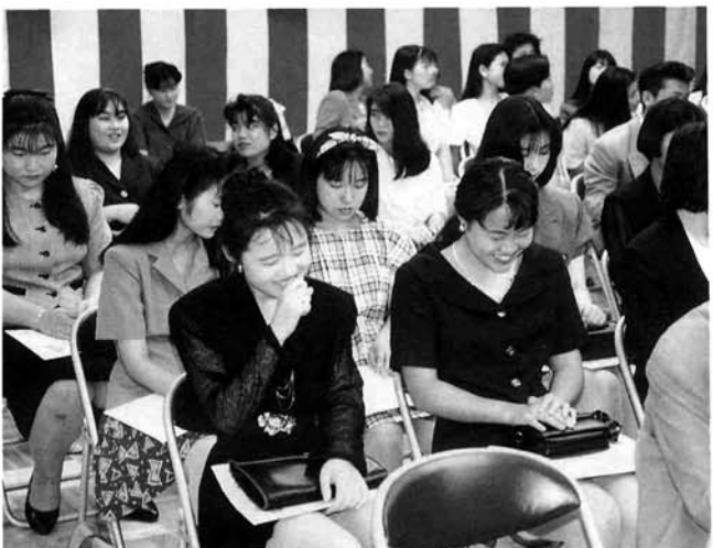
懐かしの再会に話がはずむ新成人

の意見を聞いてもらうことも大事なことです。だから、私は人との触れ合いを大事にしていきたいと思うのです。大学生活で成人としての心構えを培い、真正正銘の成人として、実社会に羽ばたいていくことを目標に頑張っていきたいと思っています。