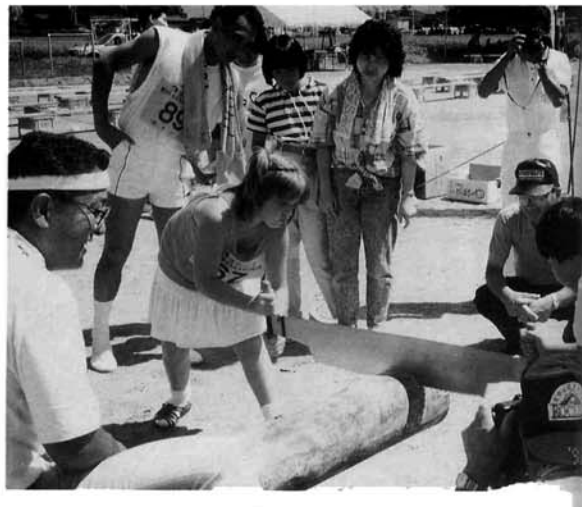
外国の方の参加もあり、全日本どころか国際丸太選手権大会となりました。