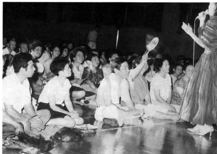
気合いの入っている小学生の女の子