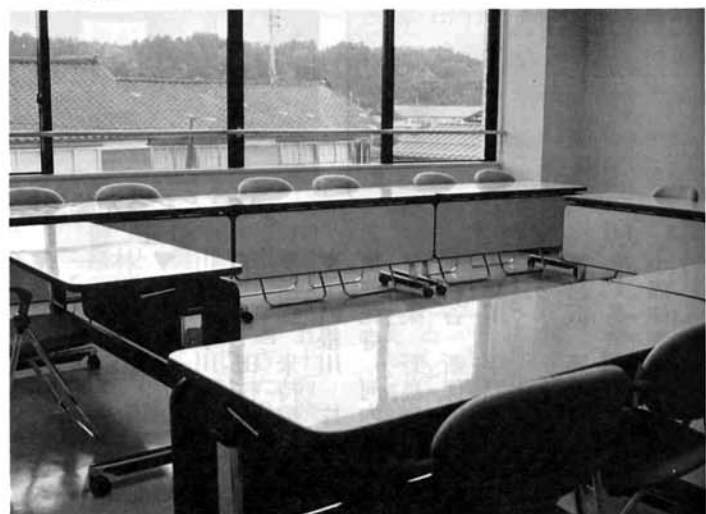
セミナー、講義室として利用できる会議室