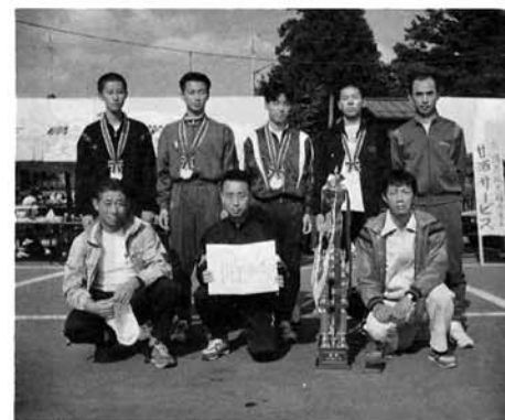
V2となった脇野町Aチーム