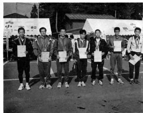
区間賞受賞者のみなさん