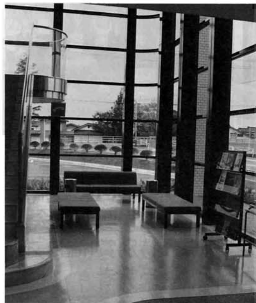
2階吹き抜けのロビーは採光十分。ちょっとした交流サロンでもあります。

研修室、教養文化室は合わせて100畳の大広間。膝を交え歓談できるやすらぎの場となります。