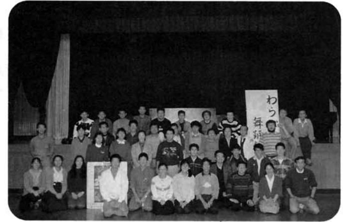
わらび座団員とスタッフ一同