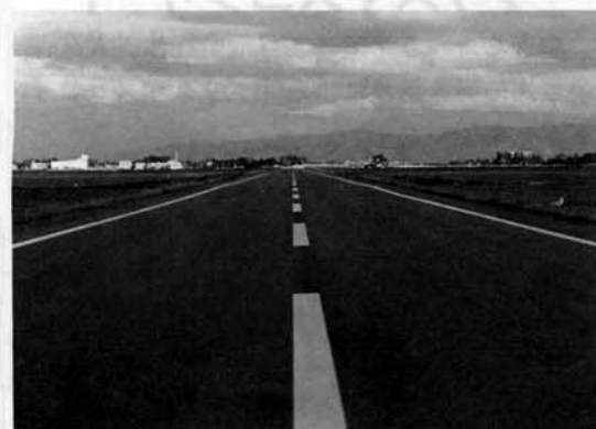
広域農道は農耕車優先となります。スピードを控え安全運転をお願いします。

脇小と日吉小の四年生約七十人が、このほど長岡市上柳町にある長岡浄化センターを訪れ、三島町から流れていく汚水が、この浄化センターできれいに処理されている様子など熱心に勉強しました。 特に、係員から汚泥をきれいにする微生物を電子顕微鏡により説明していただいたり、沈殿池ごとにきれいな汚水に興味を示していました。 平成元年度に供用開始した三島町の下水道も、現在では公共施設をはじめ約百戸近くの皆さんから御使用いただいております。 見学した子供達からは、「私の家も早く下水道にならないかなあ」「下水道っていいね!」という声も聞きました。 住みよい環境づくりのため、下水道の利用についてよくお願いします。