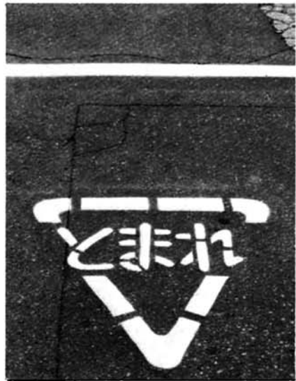
路面に書かれたトマレの表示

最近、信号無視による事故や高齢者の道路横断歩行中などの交差点関連の事故が増加しております。