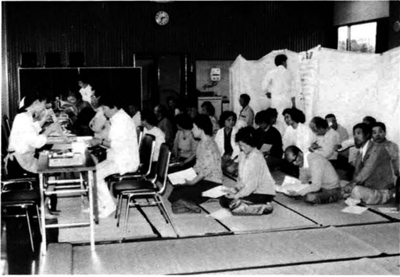
基本健康診査—受診率前年より10%上り32%

汎用型コンバインで転作麦の刈取り(6月11日) 麦の栽培が転作目標面積の20%を占め49ha、小雪で収量大、来迎寺、石津地区の大型圃場に集中