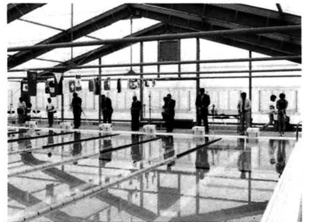
▲テープカットをする関係者