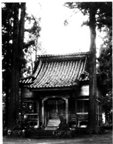
荒瀬の諏訪神社 農作・養蚕の神

で、被害者に対する補償、学校を退学になるかも知れないこと、これから一生どうなるのだろうと、十七歳の少年の心は張り裂けんばかりに切なかつたであろう。私は言った。今回の事故は、全て君の責任だ。しかし負けてはならぬ。これから一生この重圧を背負って生きなければならぬ。しかし、それも運命だ。父や母に迷惑をかけないよう頑張れ、そのため高校だけは絶対に卒業しろ、学校に頼んでおく。高校を出たら一生懸命働け、そして自分の力で補償しろ、何年何か月かかろうとも。被害者にはそう頼んでおく。いいか、決してくじけてはならない、今の