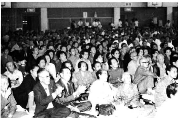
◀ 九月十五日敬老会一、〇七〇名が一同に会す