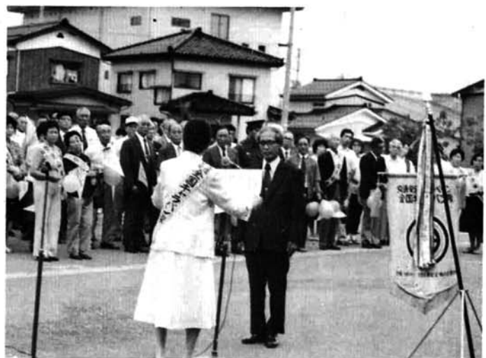
▲ 9月11日交通安全全国キャラバン隊来町 100余名出迎え(総務庁長官のメッセージを伝達)