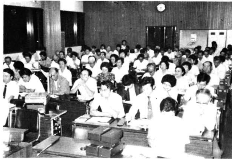
講演に聴き入る受講者