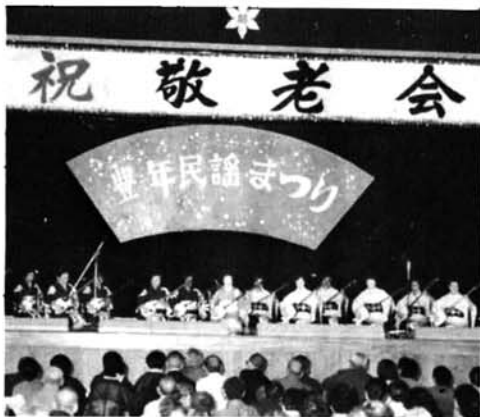
◀ 民謡協会の特別出演