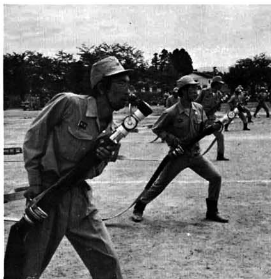
↑ポンプ操法模範演技