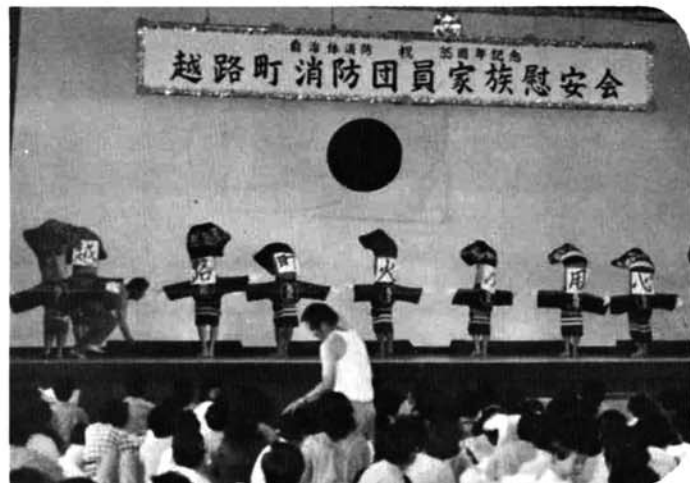
越路町消防団員家族慰安会

竿頭綬は町消防団が、多様化する災害に対処できる訓練を重ね、五十二年六月伊海川堤防決壊による被害者救援など数々の災害時活躍や住民への防火指導の防火指導等住民に信頼される消防団であることにより消防庁長官から贈られたものです。続いて五十八年度表彰で、団務及び地域の