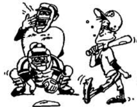
(早朝スポーツはケガに注意!)

◎ 夏休みの計画などは、そろそろ立てられているでしょうか? 日中は暑くなってきていますから、ちょっと早起きをして涼しいうちにジョギングやテニスなどをなさってはいかがですか? 気分いいですよ。ただし、あまり無理をなさらないように。