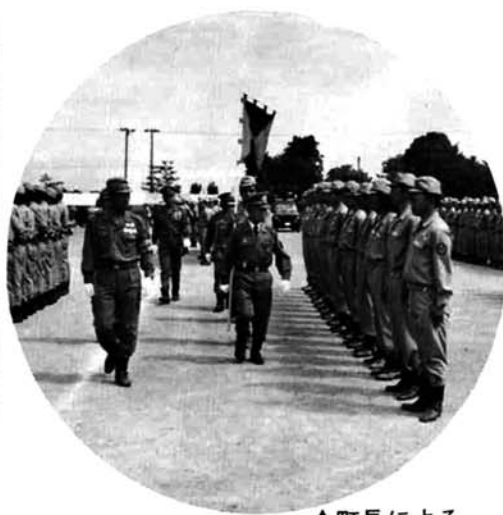
↑町長による 通常点検