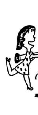
早いほどよい国民年金の加入

多くの権利が与えられると同時に、大人としての義務や責任をおわなければならない。 国民年金に加入することも、その一つです。 国民年金は、農業や漁業、商業など自営業やサービス業を営む二十歳から五十九歳までの人が加入する、老後の所得保障と生活の安定を第一の目的とした年金制度です。 国民年金に加入すると、老後の所得保障である老齢年金は勿論のこと、永い人生の途中における不幸な出来事に対しても、さまざまな年金が支給され生活の安定をはかります。 たとえば、万一の事故や病気のために障害者になった時には障害年金が、また、一家の柱である主人に先だたれ、十八歳未満の子供をかかえる母子家庭になった時には母子年金が、それぞれ支払われるほか、遺児年金や寡婦年金などの給付保障があります。 ところで、若いみなさんにとっては、年金制度とか「老後」といったものは、「今はまだほど遠い無縁なもの」と考える人がほとんどなのでしょう。若さあふれる頃とあつてみれば、それも無理のないことでしょう。 しかし、年を追うごとに高齢化していく現代社会において、「長