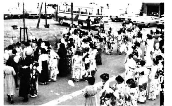
機械設備の投資を 計画されている企業者へ

めた祝賀パーティーがさわやかな雰囲気の中で繰りひろげられ、それぞれに旧交を温め、楽しい語り合いに終わりを告げるのがはばかれるようでした。午後からは、九十三名が十四回目を迎えた弥彦神社参拝に出かけ厳肅に参拝を済ませた新成人者の顔は、新たな人生に向って輝いているようでした。成人になられたみなさんのご活躍をお祈りいたします。