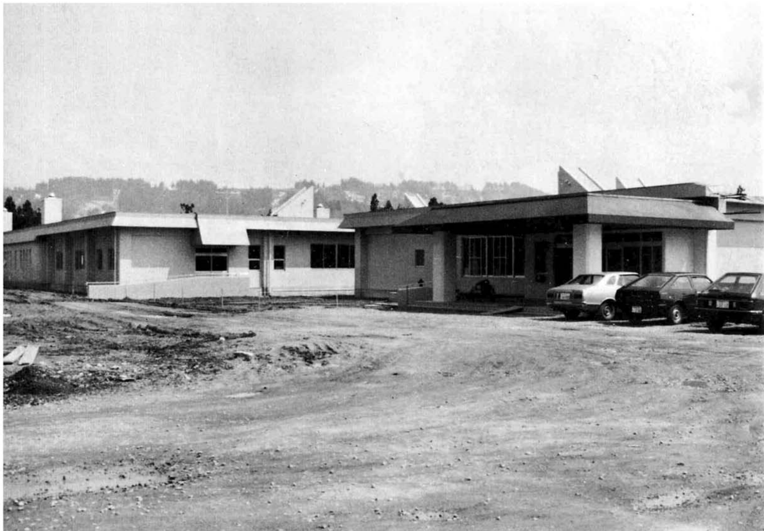
ミニコロニーみのわの里一期工事完成 4月1日開所

交通三悪一掃運動の実施 県民の努力で きずこう交通安全 交通三悪(飲酒運転、速度違反、一時不停止)による死者は、昨年中全死者の四二%に当る九十五人に達しております。四月二十五日から五月二十四日まで一ヶ月間交通三悪の一掃月間となっており、事故の多発が予想されますので、事故防止活動にみんなが協力しましょう。