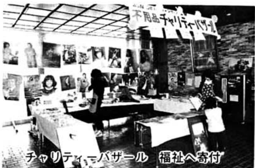
チャリティーバザール 福祉へ寄付

青春に恵まれた三月二十九日、福祉センターにおいて町連合青年会主催で「青年祭」が行なわれました。PR不足のためか、多くの町民のみなさんから……。