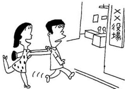
早いほどよい国民年金の加入

昭和五十六年度第一回の危険物取扱者保安講習が次の要項により行われます。これは危険物の安全管理及び危険物施設の保安の確保に努め、災害事故の防止を図るうえにおいても是非受講して下さい。