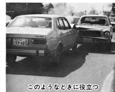
このようなときに役立つ