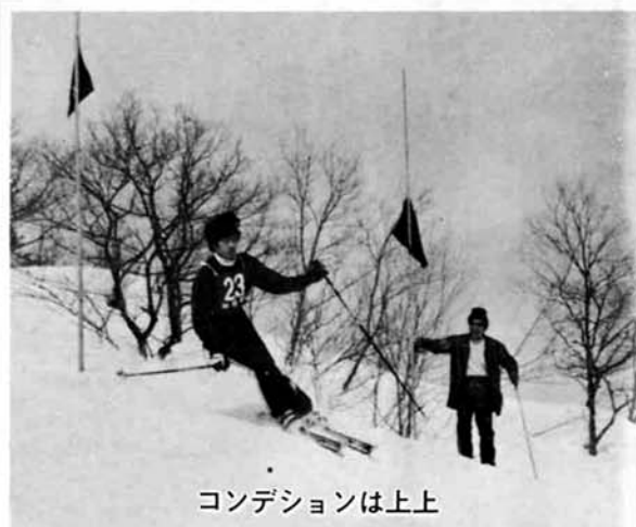
コンディションは上上

去る、二月十五日塚野山向坂スキー場で、第二〇回町民スキー大会が行われました。 当日は、天候に恵まれ多数の町民が各競技種目に参加され、立派な成績が生まれました。 結果報告は、五ページに”