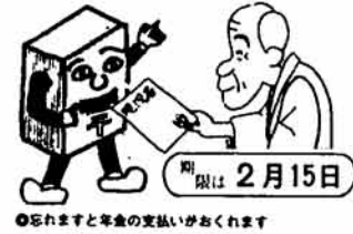
忘れずと年金の支払いがくれます

会保険庁で行われています。年金は、みなさんが裁定請求の際に希望した金融機関を通して、年に四回(通算老齢年金は年に二回)支払われます。